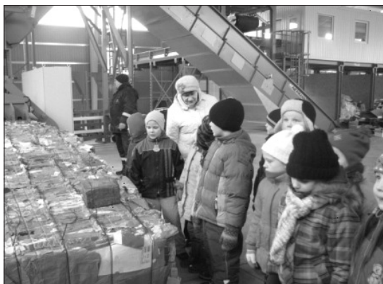
Atkritumi tiek sapresēti ķīpās.