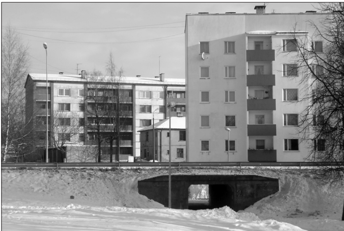
Gājēju tunelis zem Dundagas ielas.

Novada iedzīvotāji nosaukuši vairāk kā 500 problēmu, kas būtu jāatrisina viņu apkaimē. Apkopojot tās, var izdalīt šādas trīs aktuālākas problēmas: