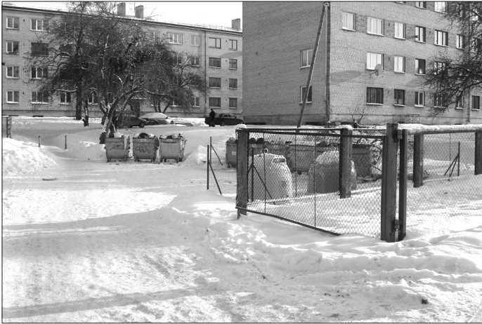
Atkritumu tvertnes pie katlumājas.

Iedzīvotāji savās atbildēs minēja, ka visnedrošāk dienas laikā jūtas uz ielas, uz ceļa, centrā, pie veikaliem. Savukārt diennakts tumšajā laikā par bīstamākajām vietām uzskatītas teritorijas pie veikaliem, autoostas, autobusu pieturas, parki, ielas un citas vietas, kur pulcējas jaunieši.