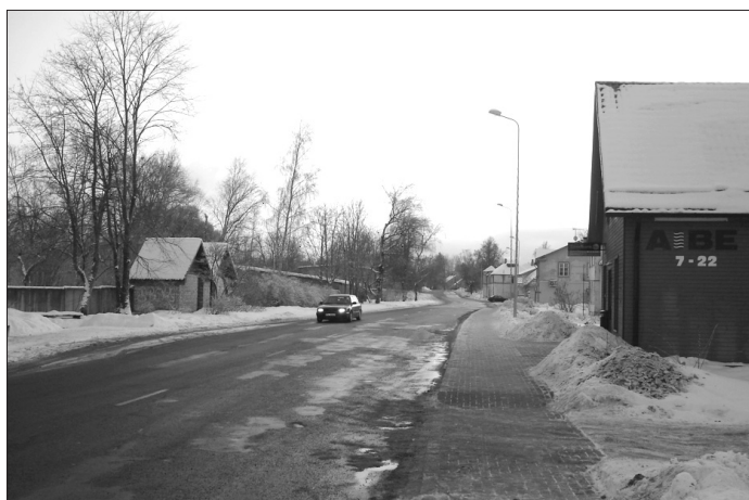
Brīvības iela Stendē.