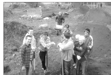
Top BMX trase Sabilē.