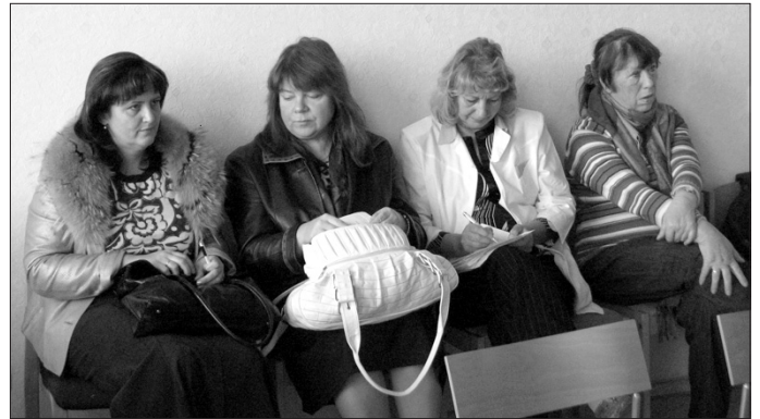
Ģimenes ārstus satrauc jaunās paaudzes ārstu aizplūšana uz ārzemēm labāk atalgota darba meklējumos.