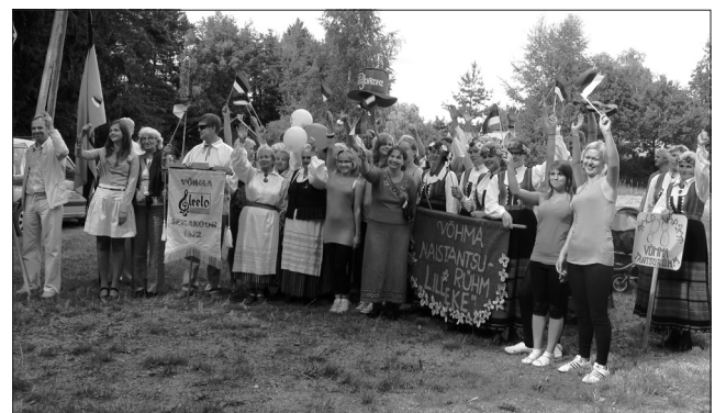
Sveiciens Stendei no Vohmas pirms „Igaunijas dienu Stendē” pasākuma Jāņu laukumā, kur tiks uzcelta vasaras estrāde.