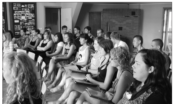
Valdemārpils jauniešu koris Vohmā mācās Igaunņu dziesmas.

No novembra līdz aprīlim lūdzam iepriekš saskaņot ierašanās laiku!