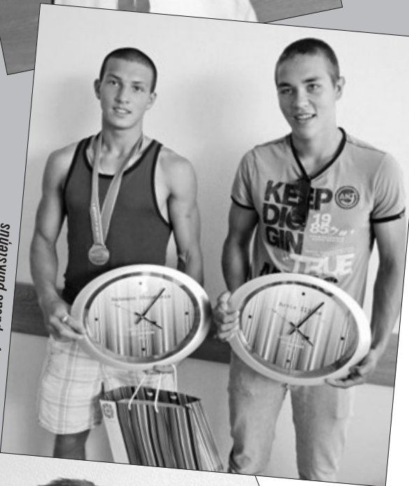
Kā pateicību olimpiēšiem pašvaldība dāvināja īpašus pulksteņus