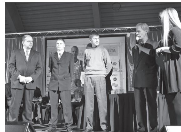
Labākā komanda – „Bebra kungs”

Šogad nominācijai „Labākā komanda” izvirzīta komanda „ Bebra kungs ”, kas ir medību šaušanas sporta klubs. Šogad komanda ieguvusi pirmās vietas divos kausa posmos, Latvijas kausu „Skrejošā cūka 35 m”, Latvijas čempionāta 2. vietu „Skrejošais alnis 100 m”, Latvijas kausa finālā 1. vietu un Latvijas čempionātā 1. vietu „Kustošais mērķis 50 m”.