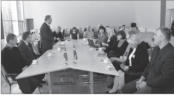
Viesu un pašvaldības vadības pārstāvju tikšanās noslēdzās ar konkrētām idejām par kopīgas sadarbības aktivitātēm nākotnē

No 28. līdz 31. janvārim, Talsu novada pašvaldībā viesojas sadarbības partneru delegācija no Lejres (Dānija) pašvaldības. Šoreiz viesu ierašanās iemesls bija viedokļu saskaņošana par turpmāko divu gadu iespējamo sadarbības projektu idejām, akcentējot sporta un kultūras nozares.