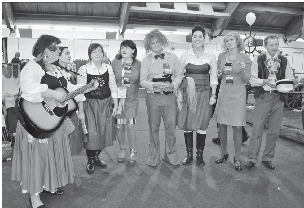
Sabiles amatierteātris pievērsa izstādes apmeklētāju uzmanību ne tikai ar saviem krāšņajiem Vīna svētku tērpiem, bet arī ar dziesmām un dažādām „dullībām” kopā ar Talsu „Madēm”

No 8. līdz 10. februārim Starptautiskajā izstāžu centrā Ķīpsalā notika 20. starptautiskā tūrisma izstāde-gadatirgus „Balttour”. Tā ir plašākā tūrisma izstāde Baltijā, kas ik gadu atklāj jauno tūrisma sezonu! Šogad „Balttour” tika sasniegts rekordliels dalībnieku skaits – izstādes hallēs „Apceļo Latviju” un „Atklāj pasauli!” varēja apskatīt vairāk nekā 300 standus, kuros savus piedāvājumus prezentēja ap 700 tūrisma uzņēmumu no Latvijas un ārvalstīm.