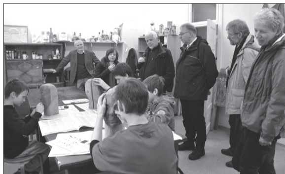
Vērojot Sabiles mākslas skolas audzēkņu nodarbību, viesi no Dānijas bija patīkami pārsteigti par Latvijas bērnu interesi dažādās mākslas jomās