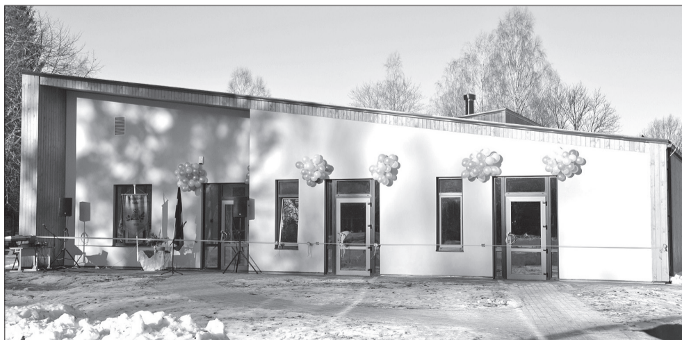
Rekonstruētā Upesgrīvas speciālās internātpamatskolas ēka

2011. gada 18. aprīlī tika noslēgts līgums ar SIA „Talsu spriegums” par tehniskā projekta izstrādi un autoruzraudzību. Būvniecības darbus veica SIA „CVS”. Projekta kopējās izmaksas Ls 284 132,00, t.sk. ERAF finansējums Ls 98 392,00.