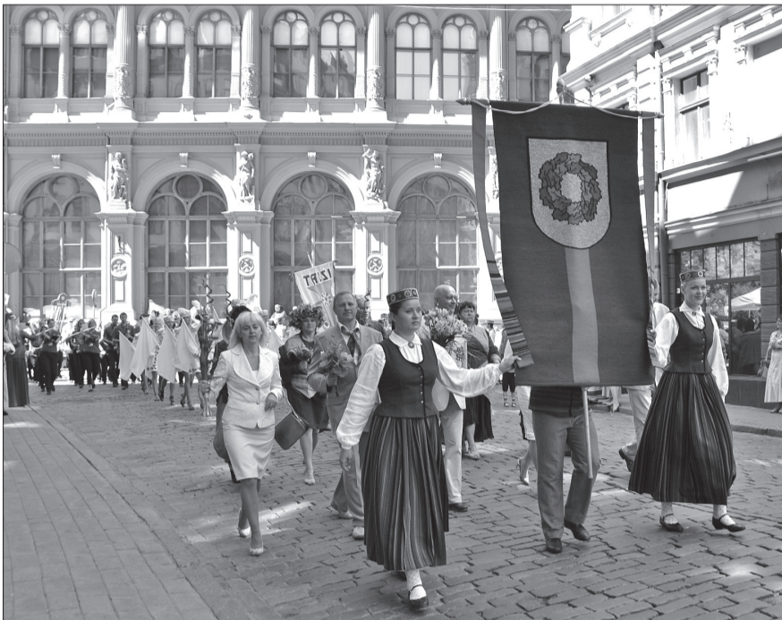
↑ Gājiena laikā Talsu novads saņēma nevienu vien uzslavas saucieni