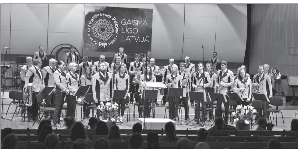
↑ Talsu pūtēju orķestris