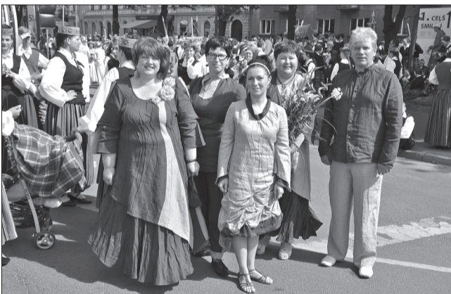
↓ Talsu novada pašvaldības rīcības grupa Dziesmu un Deju svētkos Rīgā

No 30. jūnija līdz 7. jūlijam Rīga dimdēt dimdēja no neskaitāmiem koncertiem dažādās vietās. Savu amata prasmī izrādīja arī Latvijas lietišķās mākslas kolektīvi, bet svētku kulminācija tika sasniegta XXV Vispārējo latviešu Dziesmu un XV Deju svētku noslēguma koncertos un svētku gājienā.