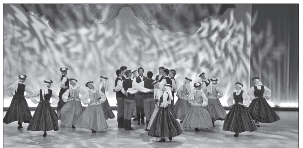
↑ „Talsu kurši”