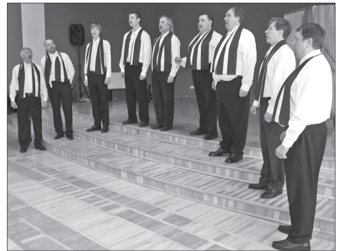
↑ Vīru vokālais ansamblis „Stende”

Arī tautas muzikanti „Tals’ Trimiš” bija to ansambļu godā, kuri varēja muzicēt un sagaidīt svētku gājiena dalībniekus. Talsu novads