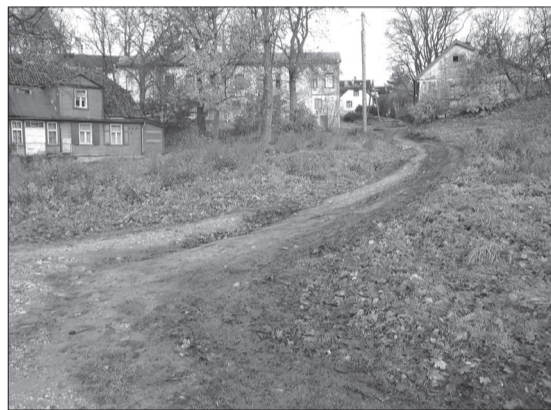
Ūdens iela pirms rekonstrukcijas

„Talsu pilsētībniecības pieminekļa piemērošana tūrisma produkta attīstībai”, kas tika atbalstīts un 2010. gada 10. martā noslēgts līgums ar VA „Latvijas Investīciju un attīstības aģentūra” par tā īstenošanu.