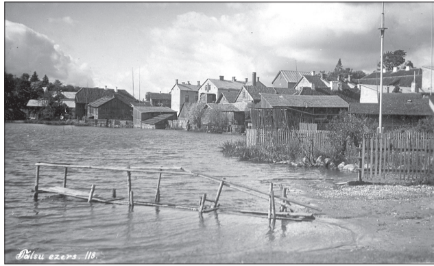
Talsu ezera promenāde 20. gs. 30. gados

Talsos daba iekļāvusies pilsētā, tāpēc tā ir viena no zaļākajām Latvijā. Talsu pilskalna apkārtni un Talsu ezera krastu iedzīvotāji un pilsētas viesi bieži izmantojuši kā pastaigu vietu. Laika gaitā ielas kvalitāte pasliktinājās – veidojās bedres, gājēju kustību traucēja nenodrošināta lietus ūdens novadīšana. Ūdens ielas posmā 60 m garumā vēsturiskais laukakmens bruģis bija sliktā stāvoklī, un iedzīvotājiem šī vēsturiskā vieta nebija pieejama. Pilskalna pakājē pārmitrās augsnes dēļ cilvēkiem ne vienmēr ir bijusi iespēja pastaigāties ap Talsu ezeru.