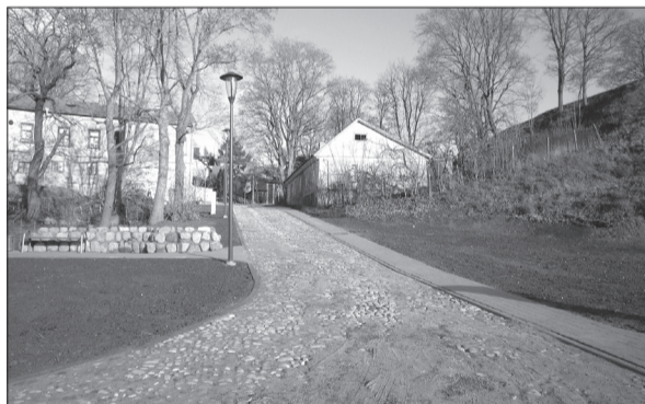
Ūdens iela pēc rekonstrukcijas

Veicot ceļa seguma rekonstrukciju promenādes daļā gar Talsu ezeru, augsnes slāņa nestabilitātes dēļ, ceļa seguma pamatnei, lai sasniegtu seguma plānoto nestspēju tika izmantoti tādi materiāli kā ģeotekstils un ģeorezģis, veikti ezera krasta nostiprinājumi. Šobrīd iedzīvotājiem un viesiem pieejama nobruģēta un apgaismota iela, jeb ezera promenāde. Gar pilskalna pakāji izveidots gājēju un velosliedžu. Ar šķēbām klātais gājēju un velosliedžu sākās pie Ūdens ielas, tālāk pārējot koka laipās ap visu Talsu ezeru līdz pat Fabrikas ielai. Ejot pa laipām, cilvēkiem būs iespēja apsēties uz soliņiem un pavērot Talsu tradicionālo ainavu. Visa celiņa garumā ierīkots apgaismojums.