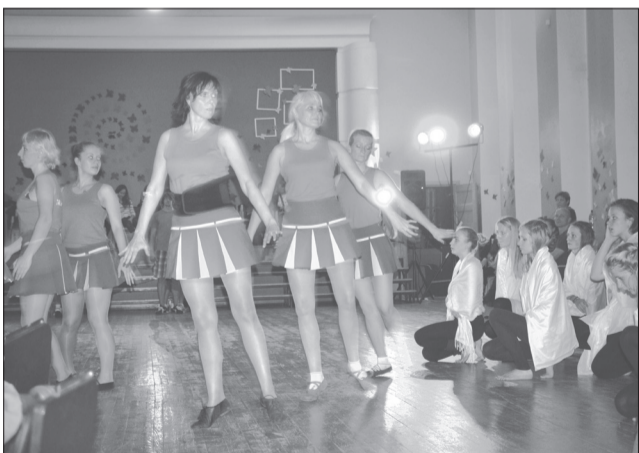
„Talsu kurši” un „Delveri” dejas izrādes mēģinājumā Talsu Valsts ģimnāzijas zālē

„No zobena saule lēca” ir dejas izrāde, ko būs iespējams redzēt 16. un 17. novembrī Rīgā, Ķīpsalas hallē, kurā piedalīsies arī Talsu tautas nama vidējās paaudzes deju kolektīvs „Talsu kurši” un Talsu Valsts ģimnāzijas jauniešu deju kolektīvs „Delveri”. Izrādes režisors ir Uģis Brikmāns, horeogrāfs – Agris Daņilēvičs, par muzikālo noformējumu atbild bungi un dūdu grupa „Aulī” un koris „Gaudēamus”.