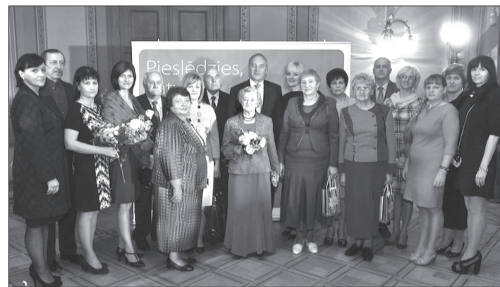
Talsu novada skolotāji, skolu direktori, seniori un viņu atbalstītāji