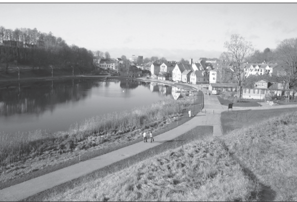
Rekonstruētā Talsu ezera promenāde

Ikvienam bieži ir vēlme nokļūt pēc iespējas tuvāk ūdenim, tādēļ Talsu ezerā ierīkotas trīs uz pontonu konstrukcijām uzstādītās laipas. Vērojot iedzīvotāju interesi par šo objektu jau tā būvniecības laikā, iespējams, šī sakārtotā vecpilsētas vieta būs viena no iecienītākajām pastaigu vietām gan Talsu novada iedzīvotājiem, gan Talsu viesiem.