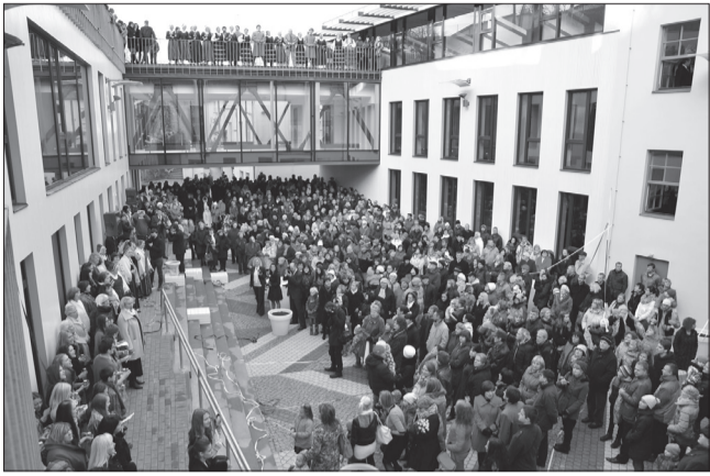
Radošās sētas atklāšanas pasākumā pulcējās ne vien amatiermākslas kolektīvu dalībnieki, bet milzums daudz Talsu novada ļaudis

Mūsu valsts deviņdesmit piektajā dzimšanas dienā, novada ļaudis pulcējās Talsu tautas namā, lai kopā justu, atcerētos un būtu Talsos, novadā, katrs savā vietā, dzīvē un liktenī. Daudziem šī diena bija nozīmīga ar to, ka tika saņemti apbalvojumi, bet citiem, ka pirmo reizi pēc rekonstrukcijas tika iepazīti Radošās sētas komplekss.