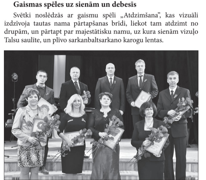
Talsu novada Gada titulu saņēmēji

Svētki noslēdzās ar gaismu spēli „Atdzimšana”, kas vizuāli izdzīvoja tautas nama pārtapšanas brīdi, liekot tam atdzimt no drupām, un pārtapt par majestātisku namu, uz kura sienām vizuāli Talsu saulīte, un plīvo sarkanbaltsarkano karogu lentas.