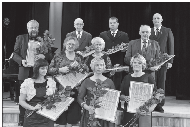
Talsu novada Atzinības rakstu saņēmēji

Talsu novada Atzinības raksts tika piešķirts arī Talsu novada pašvaldības sadarbības partnera Zviedrijas pilsētas Sēderčepingas