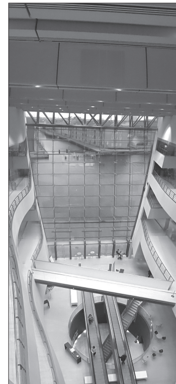
Dānijas Nacionālās bibliotēkas halle