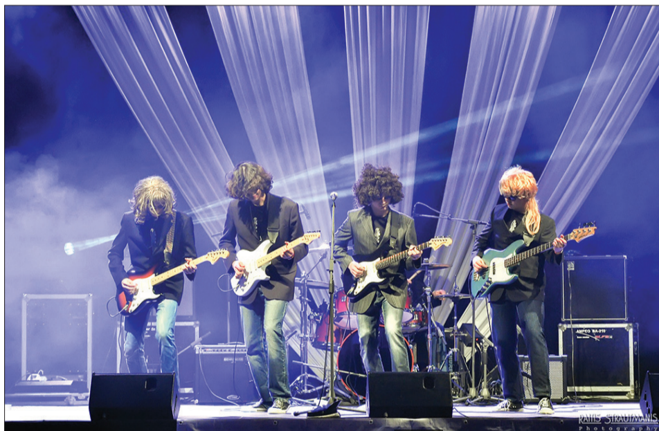
Talsu novada Bērnu un jauniešu centra ģitārspēles studijas „N” grupa „Evolution”.