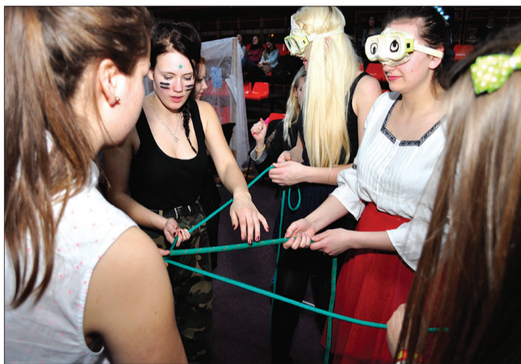
Jaunieši aktīvi iesaistās dažādās aktivitātēs.

Dienas laikā dalībnieki novērtēja arī pārējo aktivitāti viņu veidotajos uzdevumos, un par aktīvāko