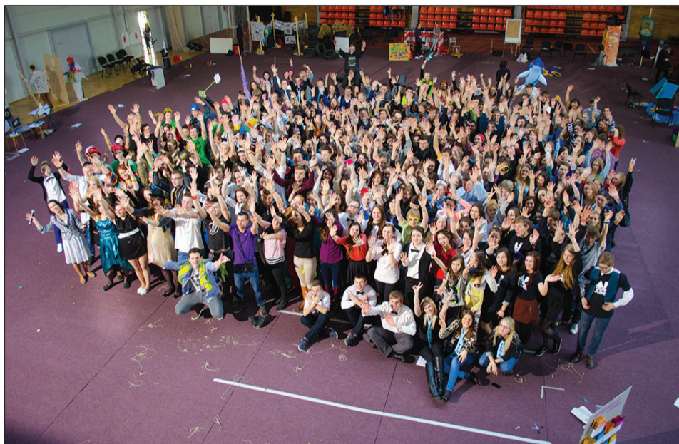
37 jauniešu organizācijas no vairākām Latvijas vietām pulcējās Talsos.