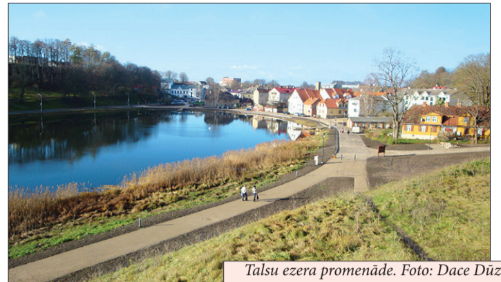
Talsu ezera promenāde.