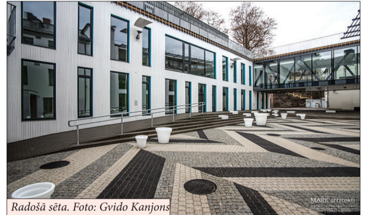
Radošā sēta.