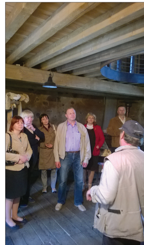
Valdgailes dzirnavu apmeklējums

Katrai pārvaldei ir savas vajadzības, taču pašvaldības finansē-