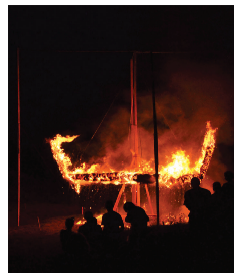
Ugunsskulptūra, autors Andris Millers