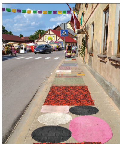
Ja citviet dižojas ar garāko ziedu paklāju, tad Sabilē – ar garāko ielu paklāju