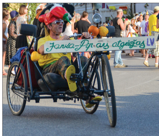
Teatralizētais gājiens „Kūka ar odziņu”