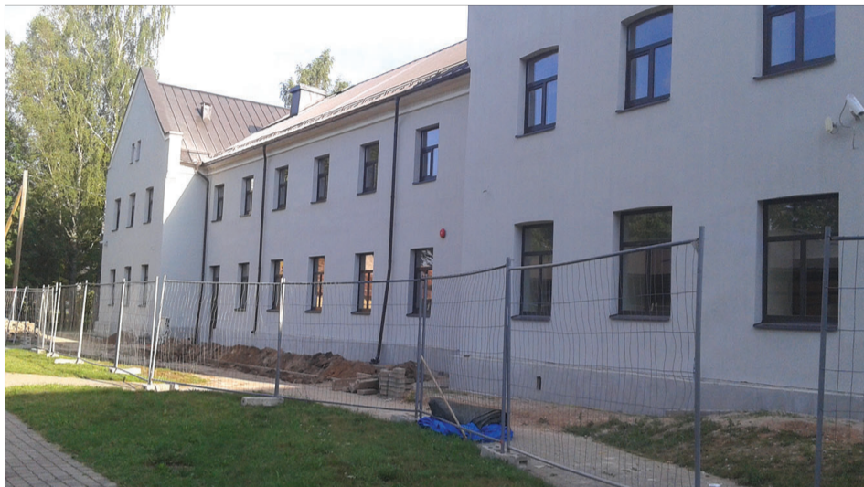
Viena no mācību iestāžu vajadzībām ir fasāžu atjaunošana. Laucienes pamatskolas fasādi rekonstruē iepirkuma konkursā uzvarējušais vietējais uzņēmums SIA „Bau Art”

piemēram, Pūņu pamatskolai tika nomainīts jumta segums, bet Virbos, piesaistot Klimatu pārmaiņu finanšu instrumenta finansējumu, uzlabota