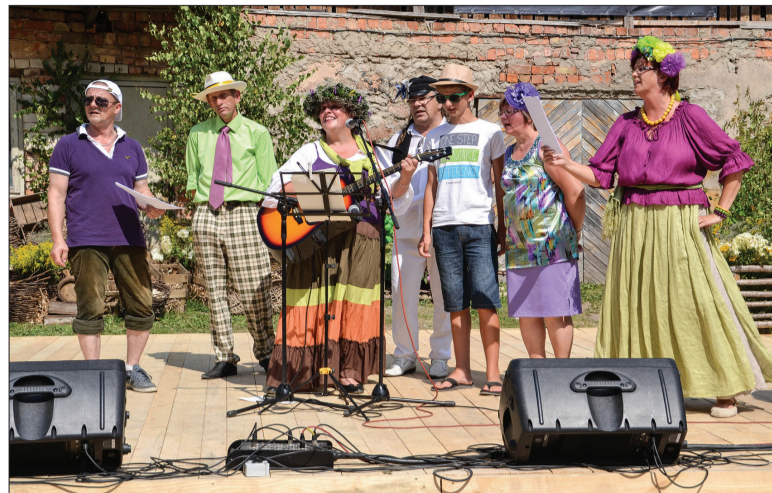
„Dziesmas ar Teklu”

Sabiles Vīna svētku organizētāji pateicas ikvienam svētku atbalstītājam, apmeklētājam, tirgotājam, vīndarim un skatītājam. Pateicoties Jums, šie svētki priecē, sajūsmina un vieno!