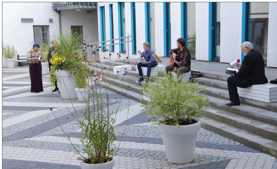
Talsu apkārtnes dzejnieku sasaukšanās ar megafoniem Radošajā sētā - dzejas rindās, dziesmās, labos vārdos un domās