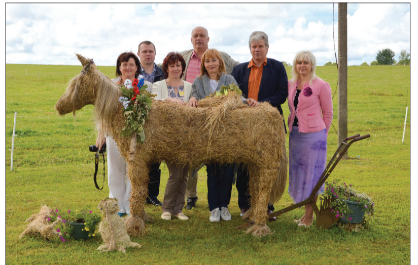
Konkursa vērtēšanas komisija

Vērtēšanas komisija ir patīkami pārsteigta par iedzīvotā-