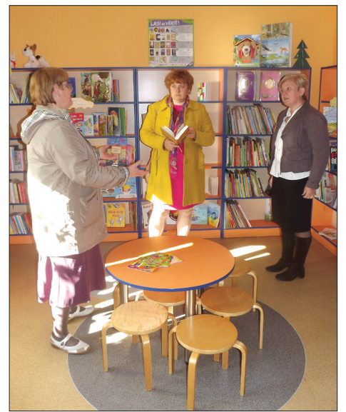
Valdemārpils bibliotēkas apskate