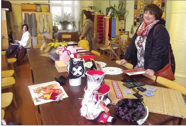
Spāres muižā līdz ar tautas lietišķās mākslas kolektīva „Nāmetiņš” darbiem top arī autentiski latviešu tautas tērpi lellēm

„Kultūras iestādēm ir ne tikai jādomā par ieņēmumu sadaļu – ko darīt, lai būtu ienākumi. Tā ir būtiska lieta, pie kā nopietni jāstrādā. Ir izvērtēti amatiermākslas kolektīvu vadītāji un speciālisti, bet nepieciešams nodrošināt viņu darbībai vajadzīgo finansējumu. Pagājušajā gadā pirmo reizi piešķīrām katram kolektīvam 140 eiro, ko varēja izmantot dažādiem braucieniem un tēpu detaļu iegādei. Kultūras nodaļa šobrīd veido plānu vairāku gadu garumā, kā