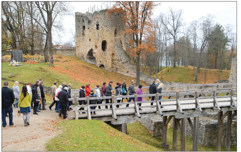
Ekskursijas dalībnieki pie Cēsu pils kompleksu

„Kad braucam kopā ekskursijā, tad saskatām to, ko līdz šim ne-