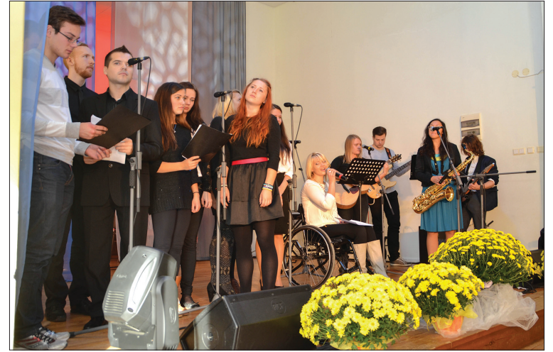
Talsu luterāņu draudzes jaunieši priecēja klātesošos ar sirsniem dziedājumiem un muzicēšanu

likvidētāju un Afganistānas kara veterānu atbalstam.