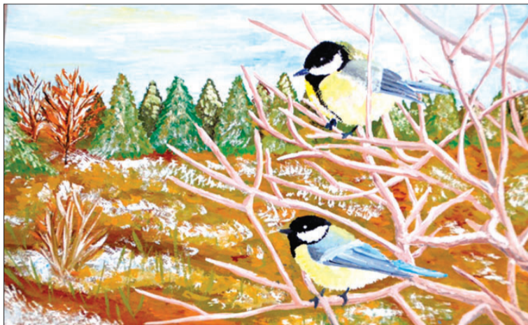
Sandijas Driņķes, Valdemārpils vidusskolas 10.klases skolnieces, zīmējums

No Talsu novada konkursā piedalījās piecas izglītības iestādes. Stendes pamatskolu pārstāvēja 15 skolēni, Valdemārpils vidusskolu – 16 skolēni, Virbu pamatskolu – 12 skolēni, Talsu Kristīgo vidusskolu – pieci skolēni un Libagu sākum-