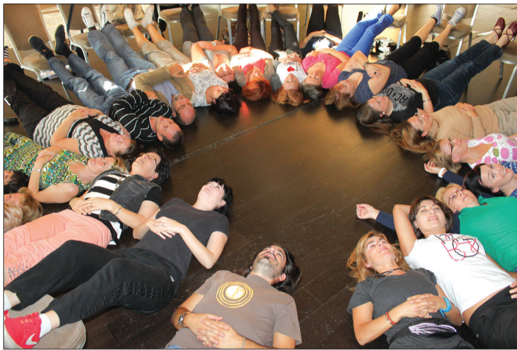
Nodarbības notiek aplī – kā vienojošā un nebeidzamā elementā

Doties uz pirmajiem kursiem, kas notika no 12. līdz 18. oktobrim Lisabonā, „ceļa somā” tika likta prezentācija par skolu, par Latviju, kolēģu labie vēlējumi. Atgriežoties šī „ceļa soma” bija pilna idejām un interesantiem darba paņēmieniem, ar informāciju par Portugāles izglītības sistēmu un citu valstu skolotāju pieredzi, stāstījumiem par savām skolām, ar draugu adresēm no dažādām Eiropas valstīm, ar uzlabotu angļu valodas prasmi, ar brīnišķīgi pavadītu laiku, ar iespējamiem, kas gūti, gan apmeklējot skolas, gan atrodoties Atlantijas okeāna krastā un apskatot vienu