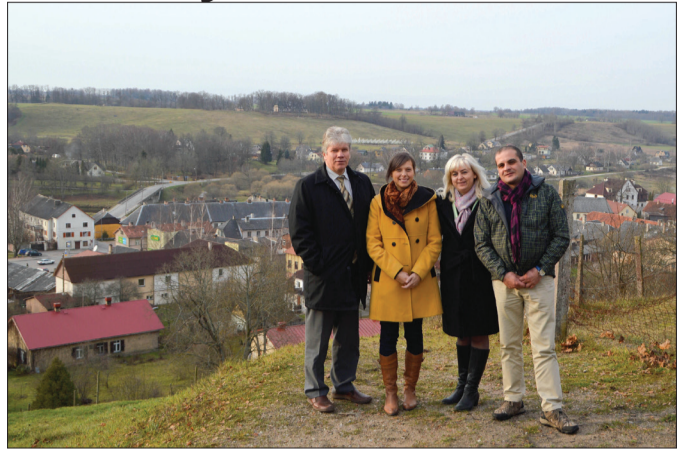
Viesojoties Sabiles Vīna kalnā