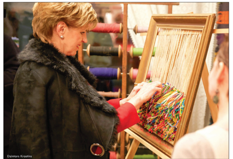
Arī Eiropas Parlamenta deputāte Inese Vaidere Talsos ieauda kopīgu stāstu