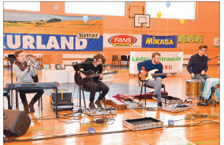
Pēc jauno mūziķu grupas „Carnival Youth” autogrāfiem rindā stāvēja gluži katrs pasākuma apmeklētājs

2014. gada grāmatu olimpiādes uzvarētāji ir zināmi un noskaidroti. 5+ grupā 1. vietu ieņēma „Runcis Puncis” (Robs Skotons), 2. vietu – „Vistiņa iemilējusies” (Karīne Lorēna), bet 3. vietu – „Astoņi kustoņi” (Ojārs Vācietis). 9+ grupā par uzvarētāju atzīta grāmata „Ada un peles rēģis” (Kriss Ridels), tai seko „Tēvocis Fjodors” (Eduards Uspenskis) un