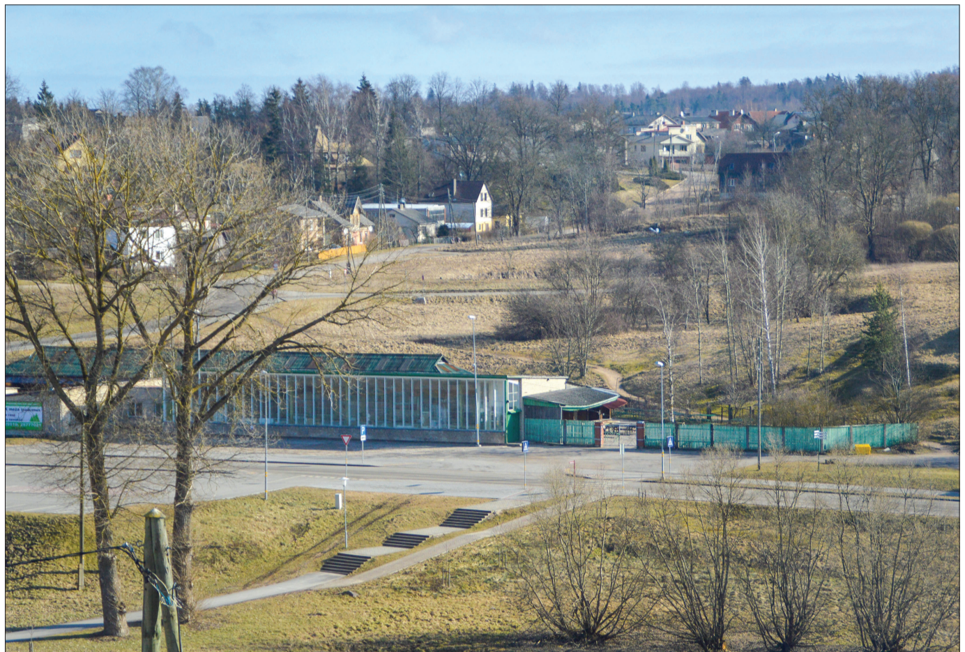
Talsu tirgus rekonstrukcija ir alternatīvā projekta ideja investīciju plānā. Drīzumā tik izsludināts Talsu tirgus metu projektu konkurss.

Kopējais finansējuma apjoms 3.3.1. aktivitātē ir nepilni 500 000 eiro. Par prioritāro ideju noteikta Raiņa ielas infrastruktūras pārbūve Talsos. Šī iela šobrīd visvairāk atbilst plānotās programmas kritēri-