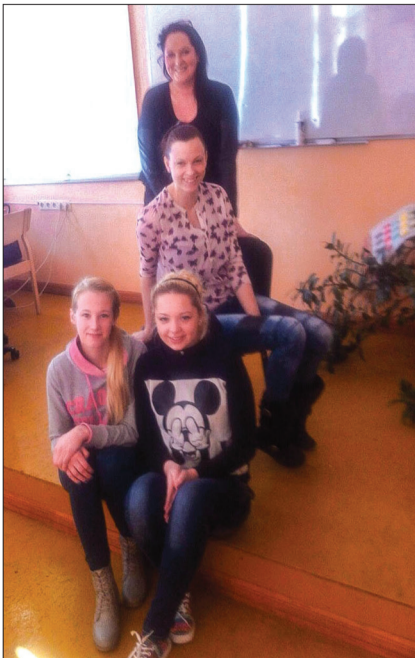
Komerczinību konkursa dalībnieces

gūst komerczinību un būvnieku specialitāti, audzēkņi nav daudz, bet tur esošie puīši ir īstēni lietaskoki. Viņi būs ļoti speciālisti.