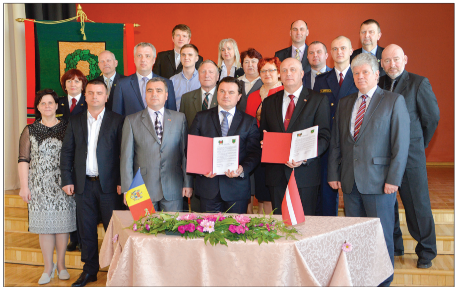
Pēc svinīgā Nodomu protokola parakstīšanas kopā ar pašvaldības pārstāvjem