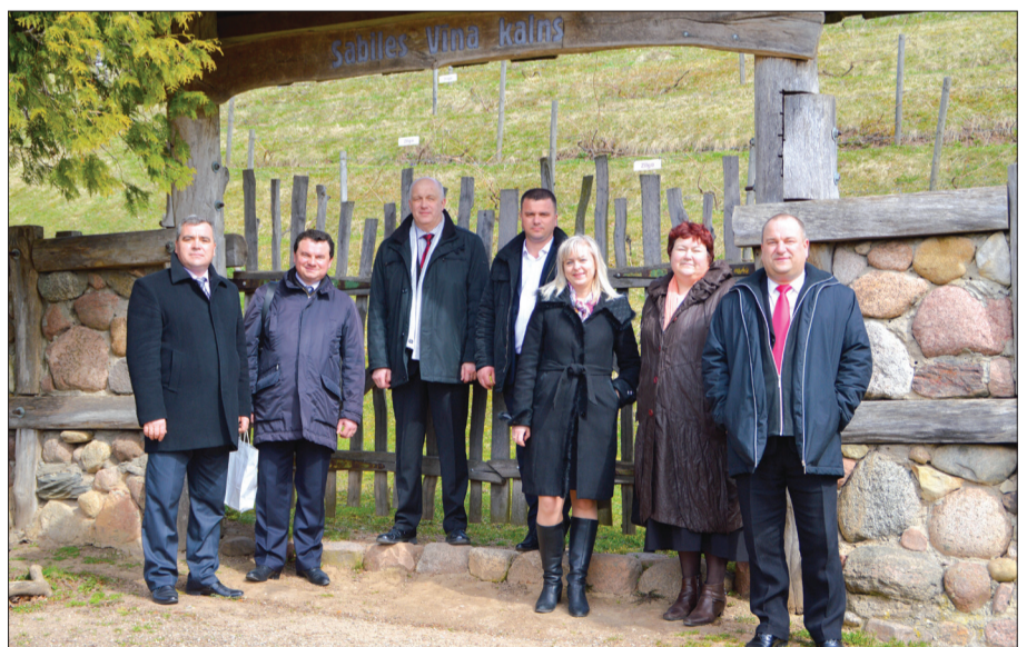
Viesi apmeklēja Sabiles Vīna kalnu

„Talsu novada simboliskā attēlots ozola lapu vainags, bet mūsu – divi ozoli. Gan Talsos, gan Orhei svarīgākie ir iedzīvotāji – strādājam cilvēku labā, un šajā jomā mums var palīdzēt jūsu pieredze,” teica Orhei pilsētas mērs.