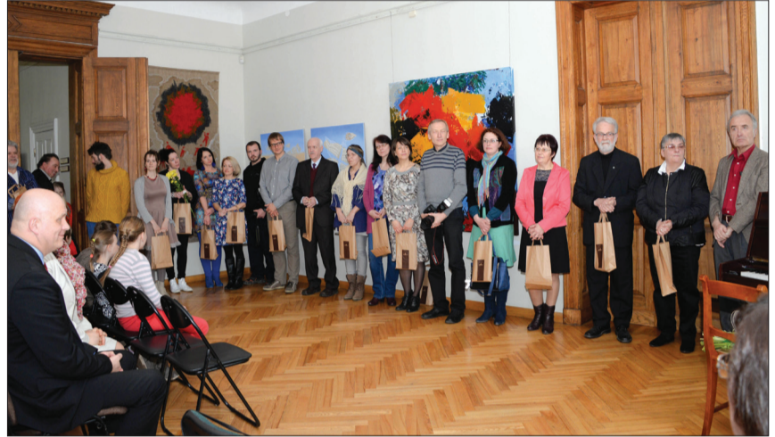
Šogad Mākslas dienās kopumā Talsu novada muzejā aplūkojami 36 mākslinieku darbi, kas ir rekordliels skaits

sniedza Valdemārpils sieviešu ansamblis.