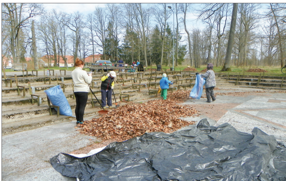
Libagos tika sakopta brīvdabas estrāde