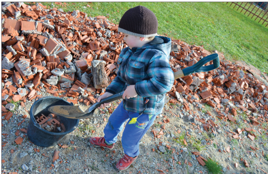
Mazākais, bet nīprākais talkas dalībnieks Valdgale