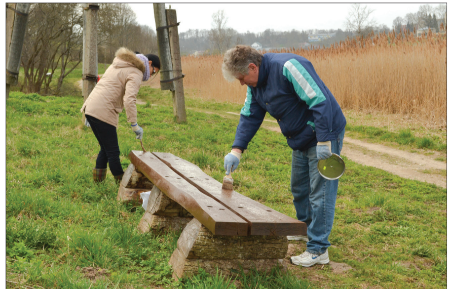
Talsu novada pašvaldības administrācijas darbinieki jau ceturto gadu sakopa teritoriju ap Vilkmuižas ezeru