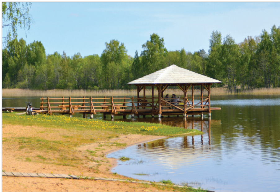
Sasmakas ezera glītā nojumīte vasarā nekad nebūs tukša, jo cilvēki jau šobrīd steidz tur labprāt uzkavēties