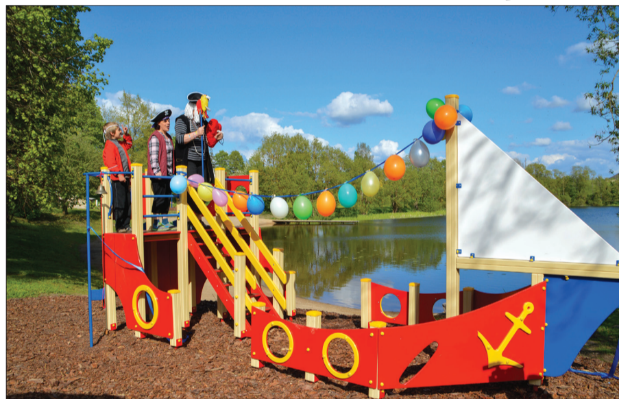
Pie Mundigu ezera tagad ir gan labiekārtota peldvieta, gan rotaļu laukums bērniem

pējām izmaksām, kas bija ap 57 000 eiro, Eiropas Savienības Zivsaimniecības fonda finansējums sastādīja ap 12 000 eiro, bet pārējos līdzekļus nodrošināja Talsu novada pašvaldība.