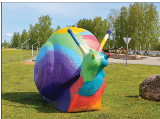
Īpašs akcents pie Sasmakas ezera – krāsains gliemezis