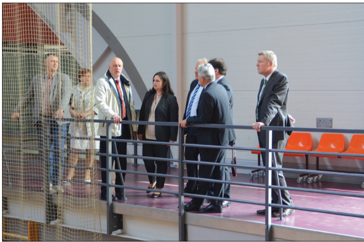
Talsu sporta hallē

nāzijas sporta zāli, kā arī pirmskolas izglītības iestādi „Sprīdītis”. Bērnodrāzā „Sprīdītis” viesi uzskatīja visilgāk, jo viņus patīkami pārsteidza mazo audzēkņu zināšanas un iestādes piedāvātās iespējas – piecgadīgie bērni jau prot lasīt un rakstīt, šeit bez maksas ir iespēja saņemt gan fizioterapeitu, gan logopēda pakalpojumus, profesionālu vadību notiek mūzikas un sporta nodarbības, trīs reizes dienā ir ēdināšana, un bērnodrāzā ir atvērts jau no 7.00. Viesi ieguva labu pieredzi, ko izmantot savās izglītības iestādēs. Jāpiezīmē, ka Cellē ir astoņas pirmsskolas izglītības iestādes, no kurām tikai viena ir pašvaldības iestāde, bet pārējie ir baznīcas vai Sarkanā Krusta bērnodrāzī.