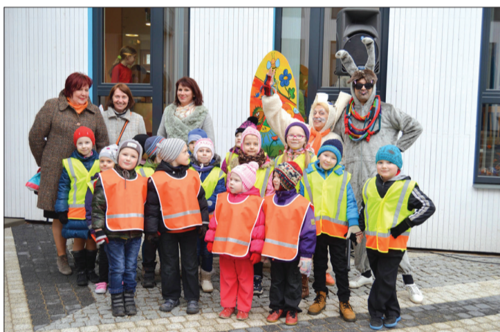
PII „Kastanītis” grupiņa „Bitītes”, apmeklējot pasākumu „Olu ola” Radošajā sētā