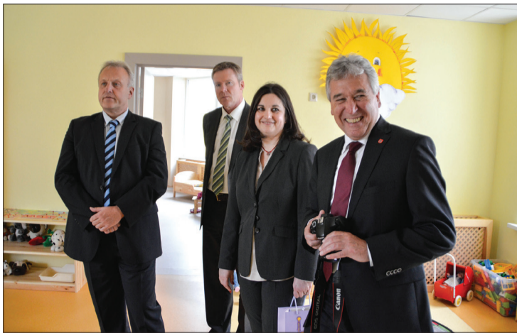
Viesojoties PII „Saulīte”

Viesi apmeklēja Talsu tautas namu un Radošo sētu, Talsu sporta halli un Talsu Valsts ģim-