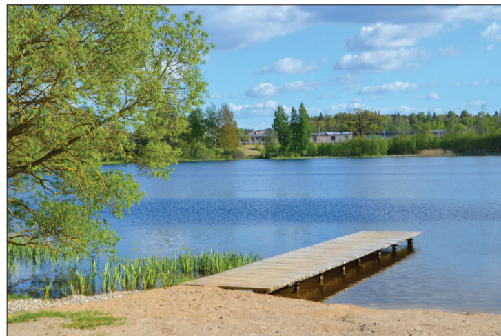
Mundigu ezera labiekārtotā peldvieta

sone. „Tas ir radošas komandas, kas ir īstēni savas vietas patrioti, veikums. Skatījāmies uz šo teritoriju un prātojām, ka te kaut kā vēl pietrūkst. Redzējām, ka šo teritoriju vasarā apmeklē cilvēku pulki, arī bērni, kuriem nebija piemērota rotaļu laukuma. Tā arī tapa šis projekts. Priecājos, ka iecere nav palikusi tikai idejas līmenī” viņa piebilda.