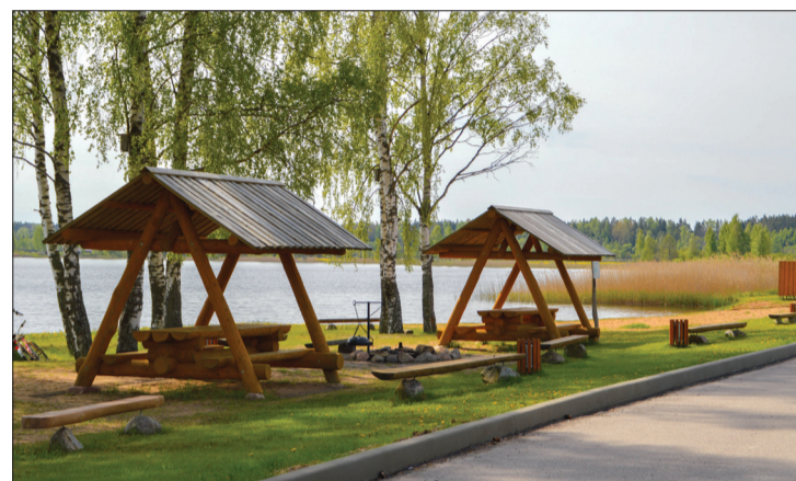
Atpūtas vieta pie Sasmakas ezera

Projektā, kas paredz nodrošināt drošu vides pieejamību visu paaudžu un teritorijas iedzīvotājiem, veicinot veselīgu