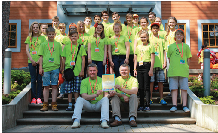
Talsu novada BJC pūtēju arķestris, iegūstot Zelta diplomu