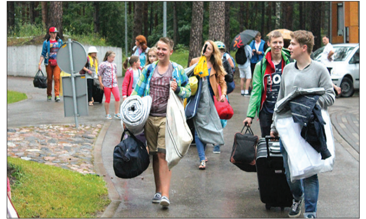
Iekārtojoties Rīgas Sanatorijas internātpamatskolā

Teksts un foto: Līva Maķe, Talsu novada Bērnu un jauniešu centra jaunatnes lietu speciāliste