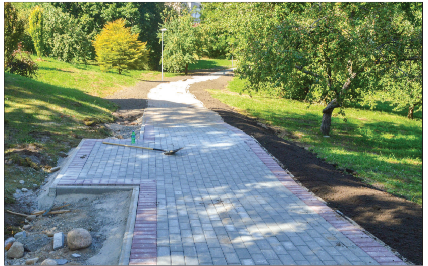
Talsu Valsts ģimnāzijas teritorijā atjaunots gājēju ceļiņš