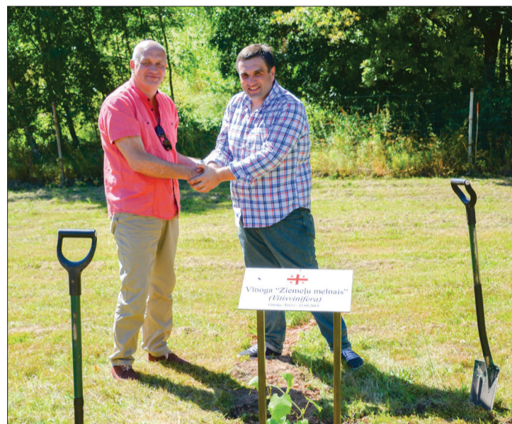
Telavi mērs un Talsu novada domes priekšsēdētājs Eiropas birzī iestādīja Ziemeļu melno vīnogu