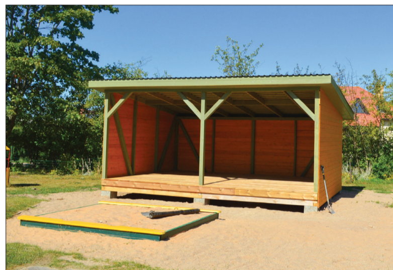
PII „Pilādzītis” uzstādītas četras vaļēja tipa nojumes

13 300 eiro PII „Pilādzītis” uzstādītas četras vaļēja tipa nojumes. „Iepriekšējās nojumes laika gaitā bija nolietojušās un kļuvušas bīstamas. Nojumes, uzvarot iepriekš izsludinātajā iepirkuma konkursā, uzstādīja SIA „BauArt”. Talsu PII „Saulīte” nomainīti metāla divviru veramie vārti. Iepriekšējie bija avārijas stāvoklī, jo tos bija sabojājis smagais transporta līdzeklis,” pastāstīja A. Aveniņš.