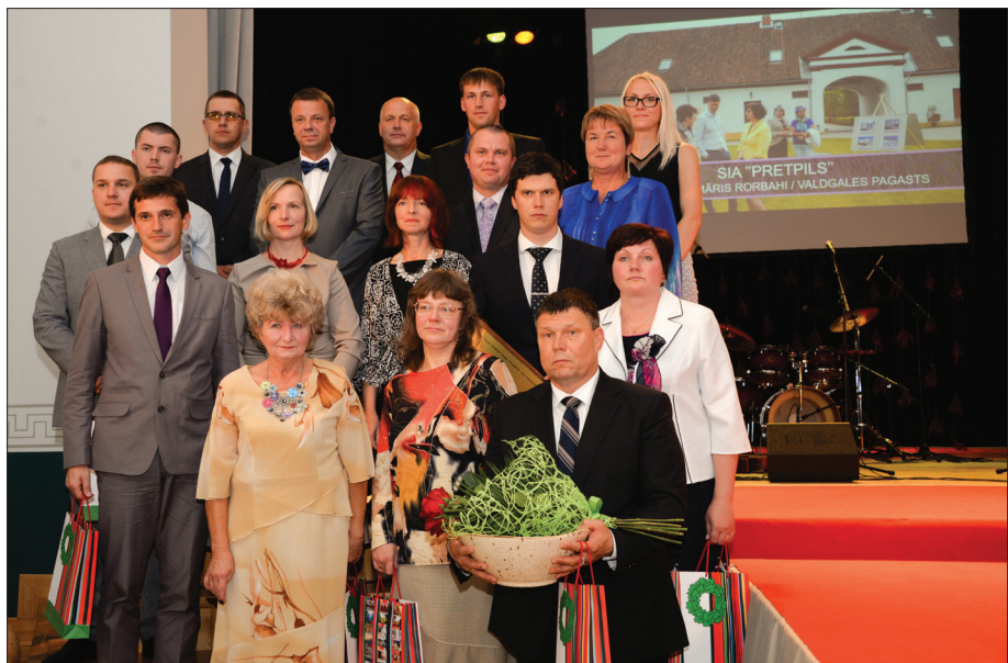
"Sakoptākā organizācija" nominanti