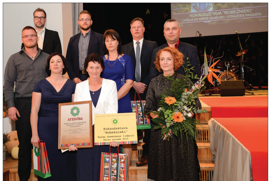
"Zaļās domāšanas līderis" nominanti