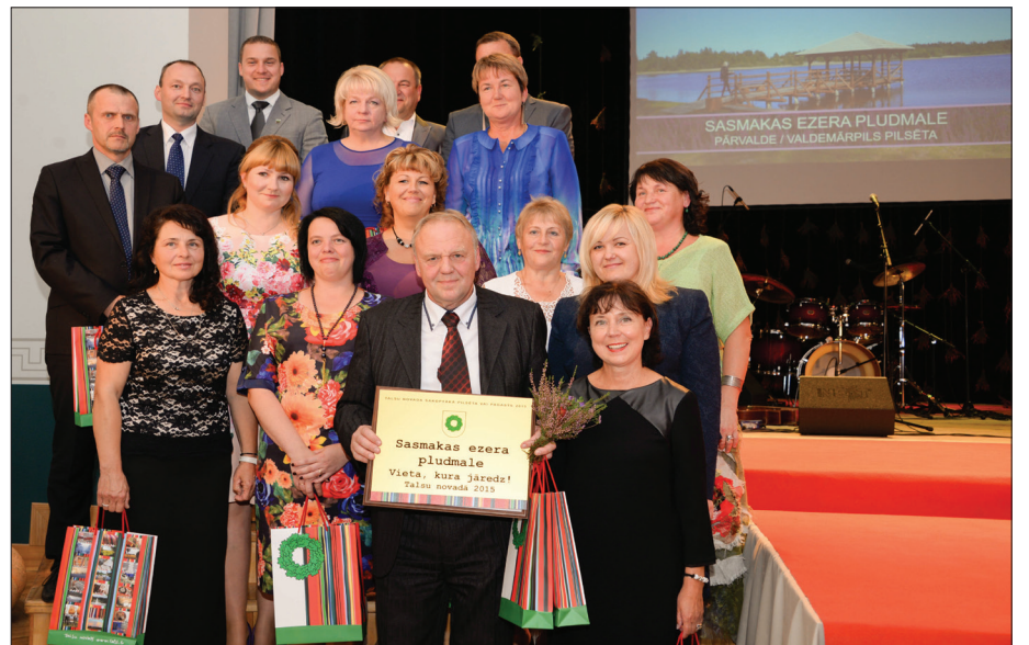
"Vieta, kura jāredz" nominanti