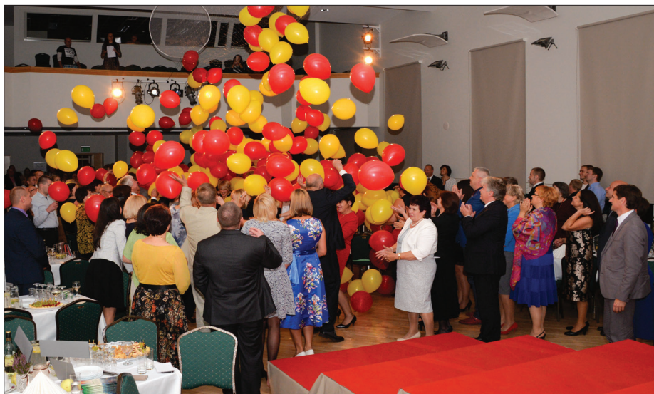
Svinīgās daļas noslēgumā visus iepriecināja balonu salūts

Talsu novada pašvaldība izsaka ļoti lielu pateicību visiem konkursa atbalstītājiem, palīgiem un tiem, kuri nesavtīgi ieguldīja laiku šī pasākuma tapšanā!