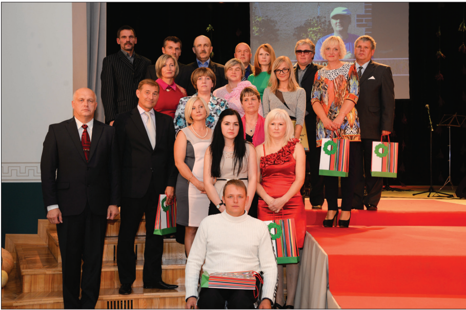
"Sakoptākā privātmāja" nominanti