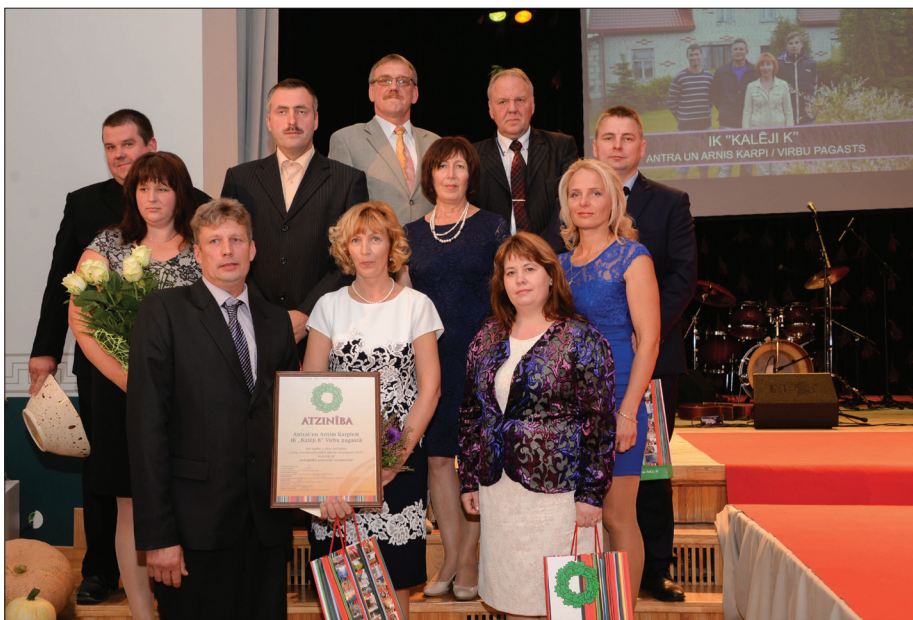
"Sakoptākā zemnieku saimniecība" nominanti