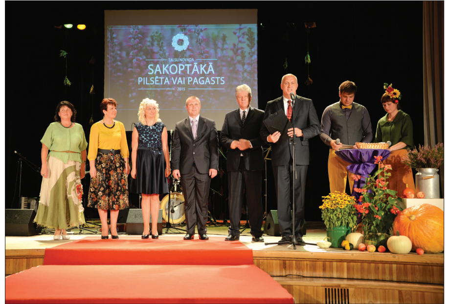
Konkursa vērtēšanas komisija

11. septembrī Talsu tautas nams mutuļoja – uz konkursa „Talsu novada sakoptākā pilsēta vai pagasts 2015” noslēguma sarīkojumu ieradās nominācijās izvirzītie laureāti, lai beidzot noskaidrotu, kam pienākas uzvarētāju lauri. Kopumā Talsu novada pašvaldība apbalvoja līderus desmit iepriekš izvirzītajās nominācijās un noteica trīs pārvaldes,