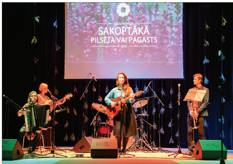
Par muzikālo noformējumu rūpējās grupa "Sus Dungo"