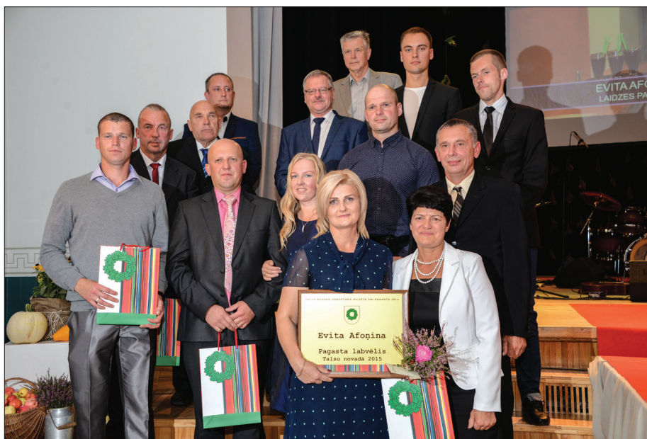
"Pagasta/pilsētas labvēlis" nominanti