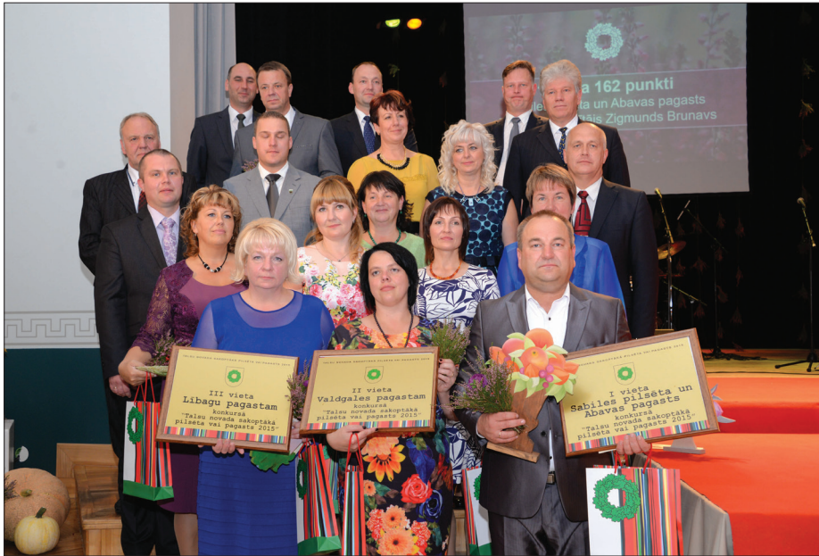
Liels paldies visiem pilsētu un pagastu pārvaldniekiem