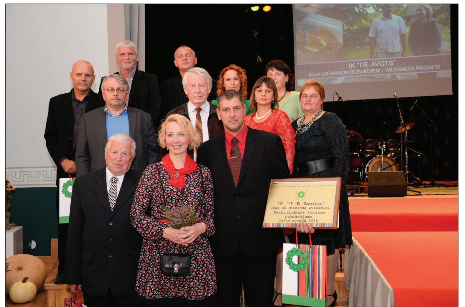
"Veiksmīgākais tūrisma piedāvājums" nominanti