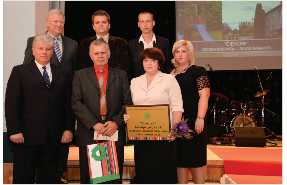
"Sakoptākā daudzdzīvokļu māja" nominanti