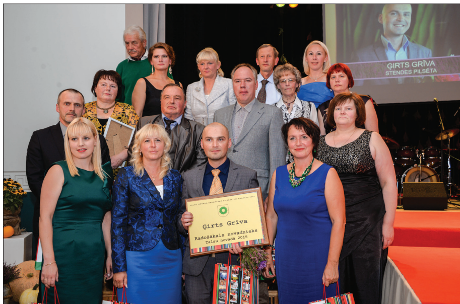
"Radošākais novadnieks" nominanti