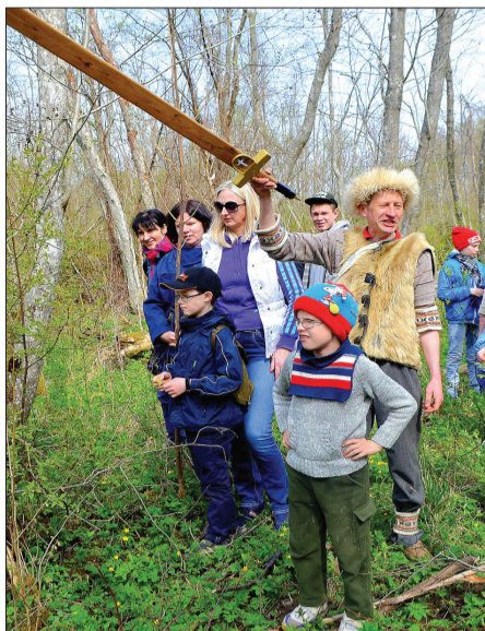
Izzini Sabili – pilsētu ar odziņu!

Pulcēšanās 11.00 pie Sabiles tūrisma informācijas centra. Nepiemirsīsim par tūrista cienīgu izskatu – atbilstošu laika apstākļiem un pārgājiena devīzei, tam jābūt pasakainam. Pasākuma dalībniekus atpakaļ no Plostiem nogādās autobuss. Pārgājiena garums apmēram 6 km, ilgums 3,5 stundas.