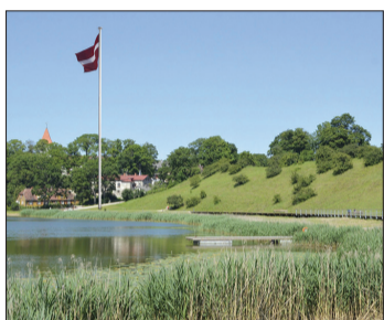
2. variantā – pie Talsu pilskalna