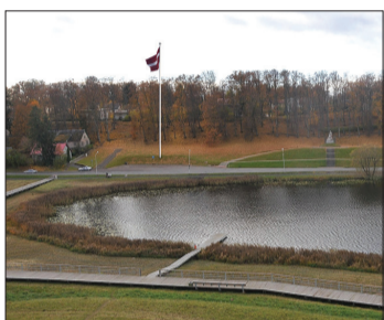
3. variantā – pie pieminekļa „Koklētājs”