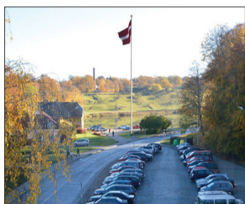
1. variantā – pie Talsu ezera

Sabiedrisko attiecību aģentūras „Repute” valdes locekle