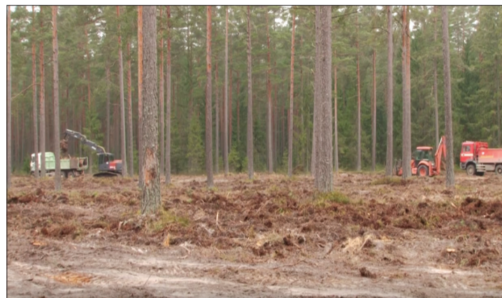
Bungu kapsētā notiek vērienīgi teritorijas paplašināšanas darbi

Kapu kultūra latviešiem ir īpaša cieņā, tādēļ regulāri novada, pilsētu un pagastu vadība rūpējas, lai pēc iespējas kapi būtu sakopti un labiekārtoti. Arī šobrīd dažādi darbi notiek vairākās Talsu novada kapsētās.