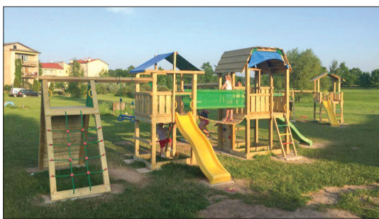
Pastendē atjaunots bērnu laukums