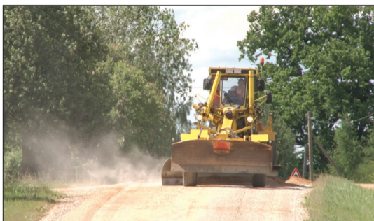
Vairāk noslogotie Talsu grants ceļi tiek pārklāti ar preputekļu pārklājumu