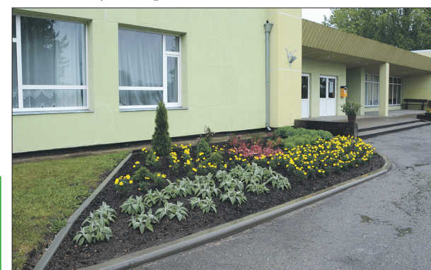
Inga Priede

Patlaban notiek katlumājas kosmētiskais remonts, tajā tiks ierīkots jauns apkures katls.