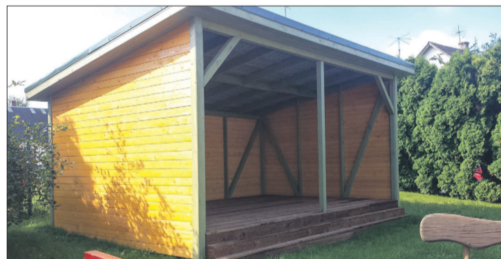
Uzstādītas trīs nojumes Talsu PII „Zvaniņš”