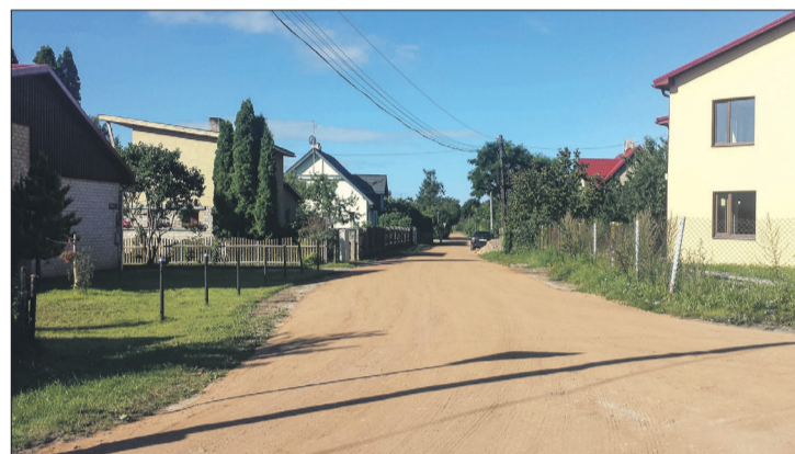
Ielejas ielā un Diķu ielā Talsos savesti kārtībā grants ceļi, kas līdz tam netika pienācīgi uzturēti