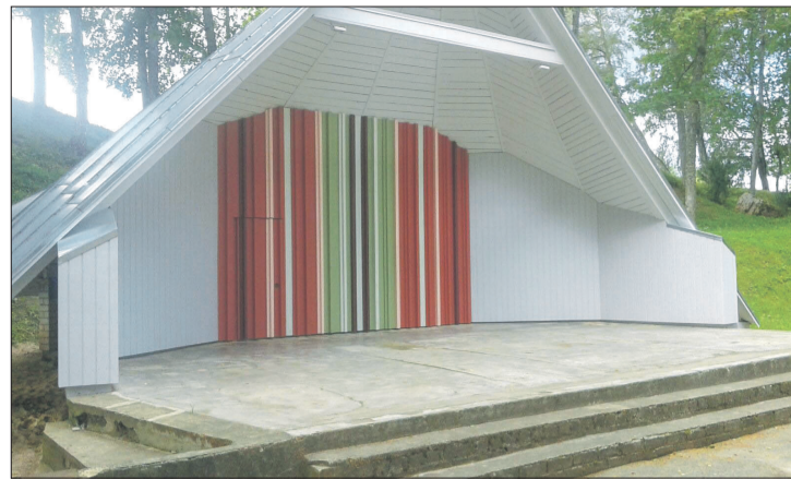
Labiekārtota Laucienes estrāde un tās apkārtnē