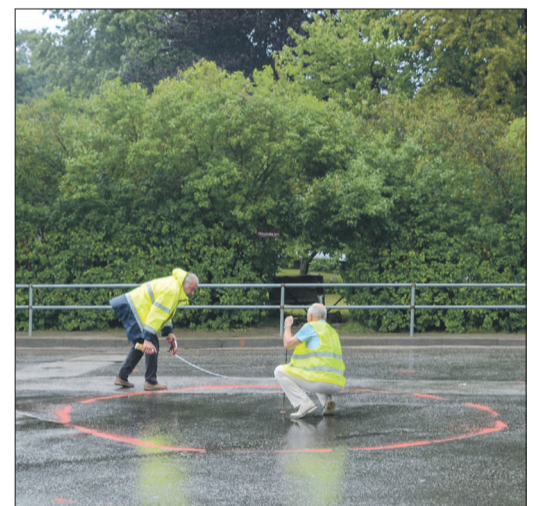
Izmēģinājuma braucienā tika secināts, ka nepieciešams paplašināt brauktuvi, lai tajā bez sarežģījumiem varētu pārvietoties satiksmes autobusi

Šajā krustojumā mācību gada laikā ir intensīva satiksme, un tā vēl vairāk ir palielinājusies, pēc tam kad uz jaunu ēku tika pārvietota pirmskolas izglītības iestāde „Sprīdītis”. Satiksmes drošības pētījumi dažādās valstīs ir pierādījuši, ka rotācijas apļa satiksmes organizācijas veids ir labāks par ceļazīmes „Stop!”