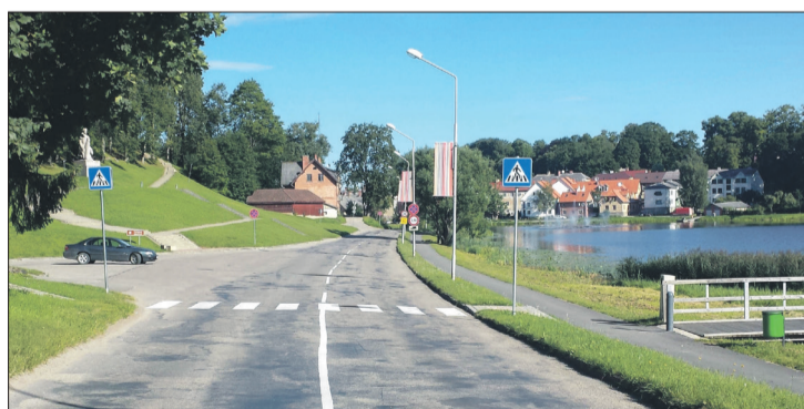
Pēc iedzīvotāju lūguma Talsos, Fabrikas ielā izveidota jauna gājēju pāreja