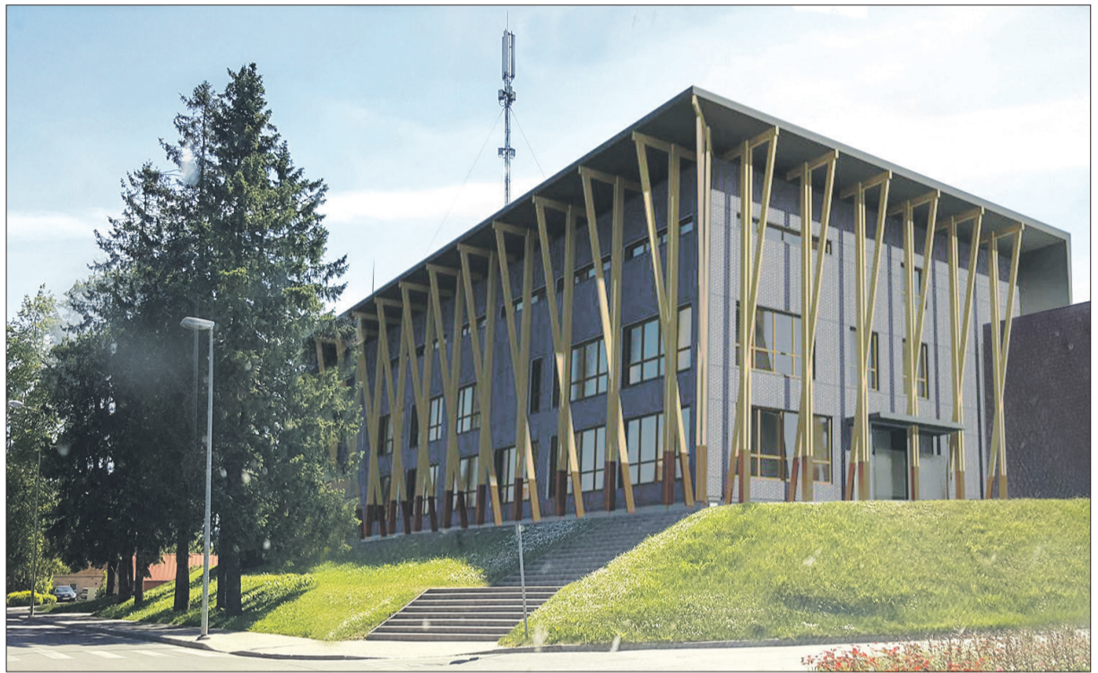
Talsu Galvenās bibliotēkas vizualizācija (attēlam ir ilustratīvs raksturs, līdz projekta īstenošanai iespējamas izmaiņas fasādes vizualizācijā)