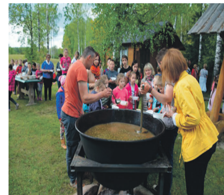
Makulatūras vākšanas konkurss ir iespēja ne tikai iegūt noderīgas balvas, bet arī izbaudīt īpašu noslēguma pasākumu – arī 2017. gadā bez tā neiztikt!

Aicinām skolas uz sadarbību, tā palīdzot makulatūrai nonākt atkritumu poli-