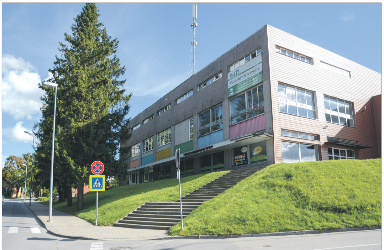
Talsu Galvenās bibliotēkas ēka Brīvības ielā 17a