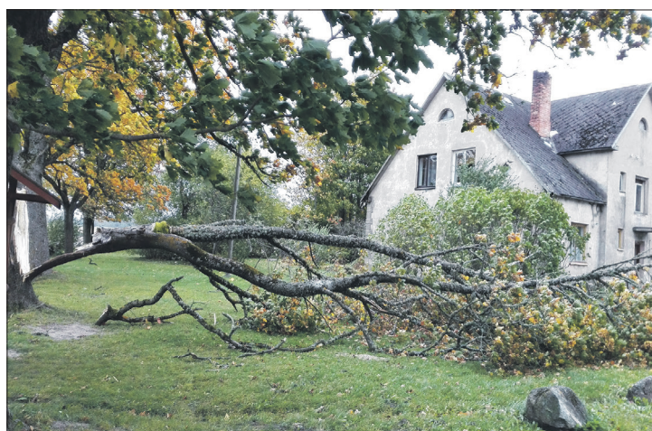
Oktobris Talsu novadā sācies ar lielām vēja brāzām, daudzviet apskādēti koki, par laimi – cietušo nav