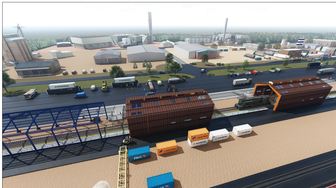
Stendes industriālā parka vizualizācija (attēlam ir tikai ilustratīva nozīme)

Šajā Eiropas Savienības plānošanas periodā paredzēts ievērojams atbalsts komercdarbības stimulēšanai reģionos, un tas lielā mērā izpaužas kā dažādu infrastruktūras elementu būvniecība. Talsu novadā lielākie plānotie objekti komercdarbības stimulēšanai ir Talsu tirgus halles un ražošanas ēku teritoriju labiekārtošana, Raiņa ielas pārbūve un industriālās teritorijas izveide Stendē.