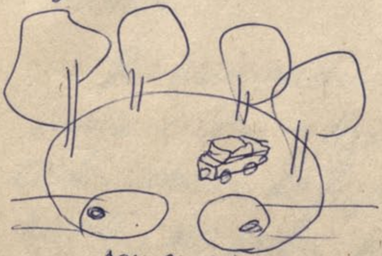
ACU PĀRIS; KĀS SPĀRŠ HŌVĪRŌVĀS AVŌRĪASĪS

Formā matreā, ar auruā dā, pāstīt aro- cēpys: dā, onēars, pāscēpys, onēstis u.c.