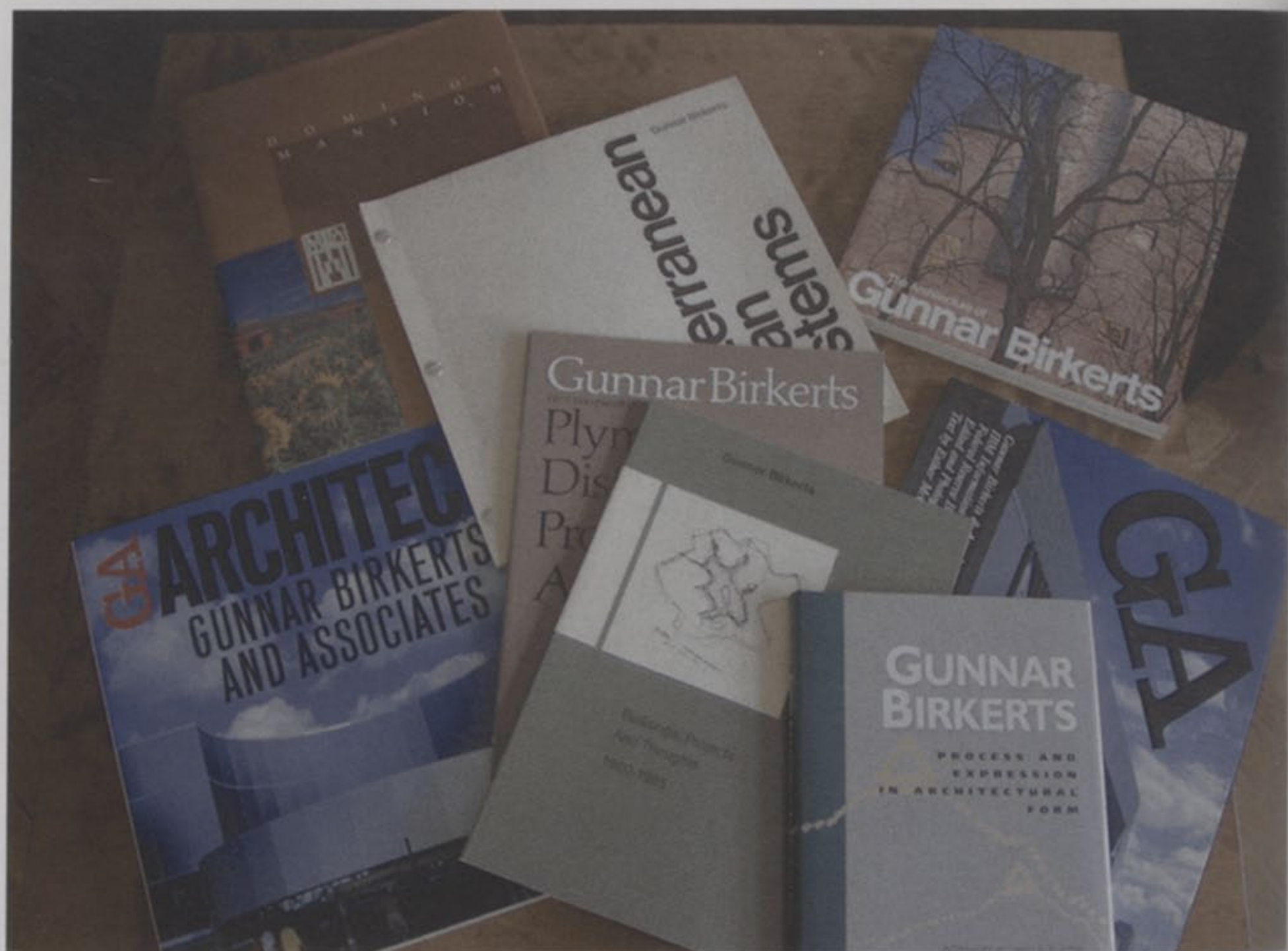
Books about the architect Gunnar Birkerts.