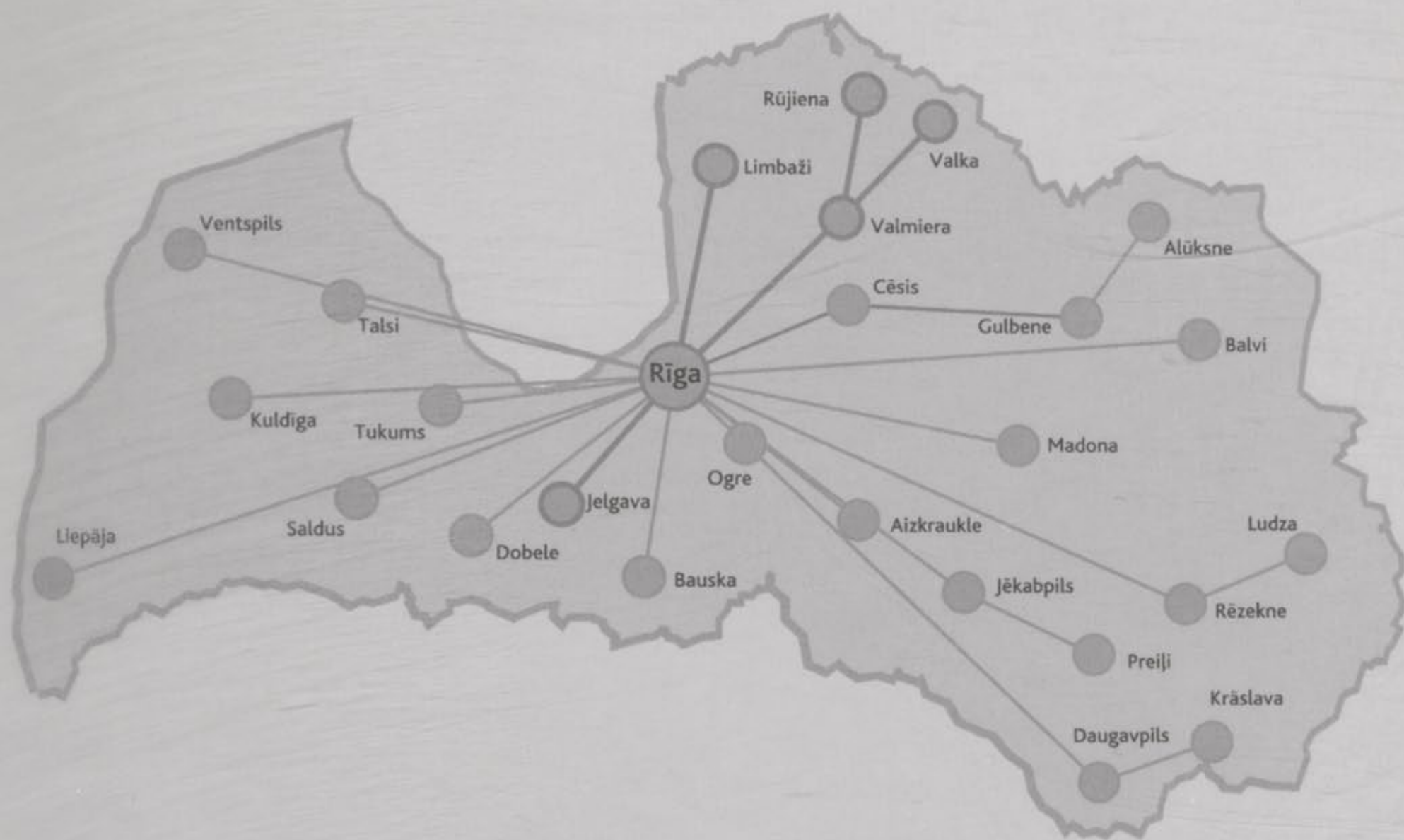
(Fig. 5) State Unified Library Information System.