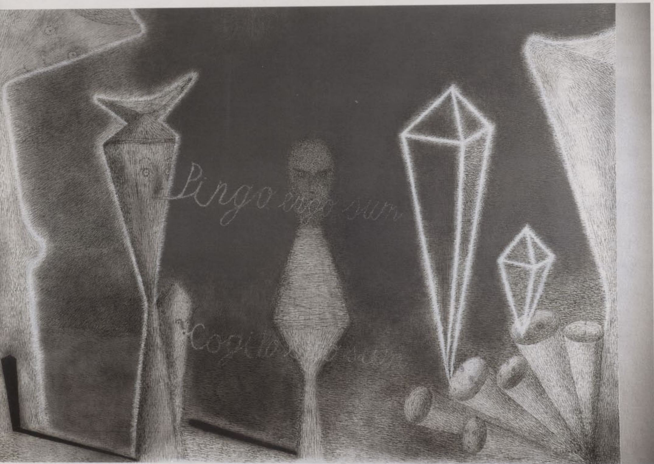
Ieva Iltnere. Pingo ergo sum , 2002, a., e., 140 cm x 190 cm / Pingo ergo sum , 2002, oil on canvas, 140 cm x 190 cm

«Maigo svārstību» forma jau tad iekšēji loģiski, vai, ja vēlaties, alogiski ietvēra un paredzēja tālāko iespējamo notikumu gaitu. Vienreiz radusies, tā it kā radīja depersonalizētu kopformu, kas nenovēršami tiecās pašrealizēties tālāk.