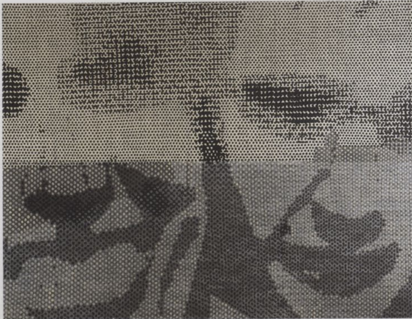
Ieva Iltnere. Jūtu ķīmija , 2002, a., e., 140 cm x 190 cm / Chemistry of Feelings , 2002, oil on canvas, 140 cm x 190 cm

Here again one should start contemplating what is a work of art in the movement called art. Perhaps it sounds like an extreme view but a work of art as such does not exist. The work of art is like a waiting-room into which we all go in the hope of buying a ticket to the decisive flight. I do not know the knowledge about art. There is no frozen state of art, work of art that would not be in constant state of transformation that could not be dissected. Why not do it time and again demonstratively. There pot is always boiling and wherever you step into it the top is always mixed with the bottom. But not on the level of knowledge – it is rather a kind of a soup of existential issues of life. Because you are the one who lives. It is not you circling round art but art around you. Art is not an object, art is «you». «To happen in art». That is apparently the reason why art cannot be defined. The definition of art can be presented only in the form of a question. And only then one can conclude «about what» it is, if that is possible at all. To be able to define or understand, one should be outside the question. And it seems to me that art is what lies within me. Perhaps Gentle Fluctuations II would pose a paradoxically cardinal but a true question about the «gentle» fluctuations of art. A ticket to a flight. With no insurance.