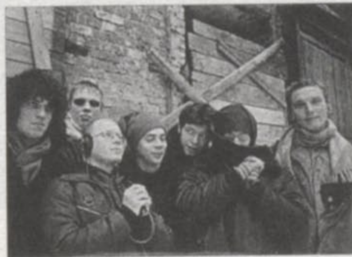
Yaputhma Sound System

We could, perhaps, come to more secure foundations by searching for changes in the language of art. This could logically connect the processuality of the previous decade with the interest of the recent years in the acquisition of the physical and geographic space. In generalising the new