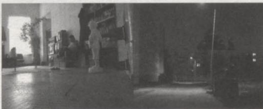
Karosta. 2003 Karosta. 2003

Pie drošākiem pamatiem, iespējams, var nonākt, meklējot mākslas valodas izmaiņas, kas varētu likumsakarīgi saistīt iepriekšējās dekādes norišu procesualitāti un pēdējo gadu interesi par fiziskās un ģeogrāfiskās telpas apguvi. Vispārinot