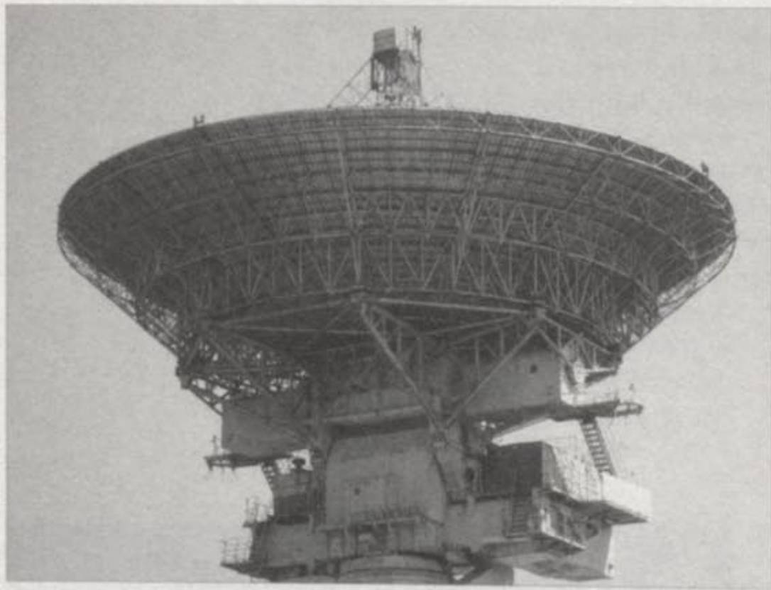
Irbenes radioteleskops. 20. gs. beigas Irbene radiotelescope. Late 20 th century

tēģiska jaunās kultūras sala kā RIXC. Ar nemateriāliem eksperimentiem un komunikāciju "ielaužoties" reālajā telpā – pamestās fortifikācijās, birojos, darbnīcās un pat mākslas augstskolās – šīs mobilās apvienības ir "ieperinājušās" mūsdienu Latvijas groteski pragmatiskajā vidē, nodrošinot alternatīvu, utopisku ideju pārklājumu. Militāri