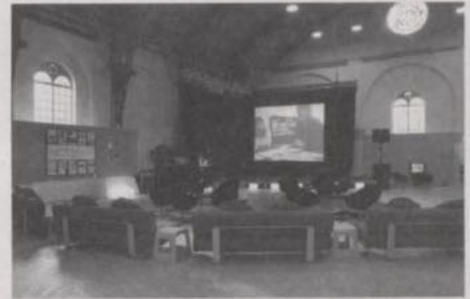
1. stacijas instalāciju ainu un notikumu dokumentācija. 1) Ārskats ar Jana Daneboda karogu projektu Mūsdienu-dāņu-inter-nacionālais (2004) un Blank Rover Visual Project veidoto reklāmkarogu; 2) skatuve un debašu zona; Foto: Eriks Balle, Tone Olafa Nilsena, Katrīna Skovgarda.

2. stacija. Orhusas Mākslas nams ir bezpeļņas galerija, kurā tiek izstādīti mūsdienu mākslinieku darbi. Mākslas nams tika izveidots 1917. gadā, un to finansiāli atbalsta gan Orhusas pilsēta, gan Dānijas Mākslas padome; galerija atvēlēja savas telpas, lai izstādītu mākslas vēstures nozīmīgus darbus, kā arī prezentētu jaunus projektus, ko daļu un citvalstu mākslinieki un mākslinieku grupas bija radījušas īpaši šai izstādei. Galerija atrodas netālu no 1. stacijas un tajā izstādītos darbus un projektus vienoja dekonstruktīva un/vai kritiska pieeja nevienlīdzības un līdzaspastāvēšanas jautājumiem tēmas attiecinot.