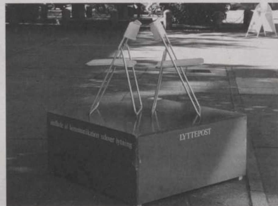
1) Morten Goll's public sculpture, Listening Post for the Danish People (2004) installed at Aarhus Town Hall Square.

Station 4: The Book was a 160-pages long publication to be regarded as a two-dimensional exhibition space for participants working with text or montage specifically. The book presented essays, projects, and montages that put the question of intolerance and co-existence into a theoretical, historical, and cultural perspective. Around the Stations, a number of Satellites were in orbit: projects, interventions, and events created for specific communities and sites in the public spaces of Aarhus by artists, cultural organizations, and theoreticians in the attempt to reach a large number of different communities and actively engage them in the theme of the exhibition.