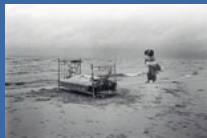
Andris Grīnbergs. „Jēzus Kristus kāzas” / The Wedding of Jesus Christ . 1972.