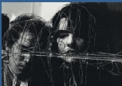
Andris Grīnbergs. „Divas Sejas” / Two Faces . 1972.