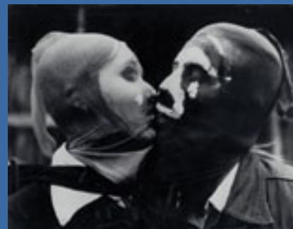
Andris Grīnbergs. „Teroristi” / Terrorists . 1974.