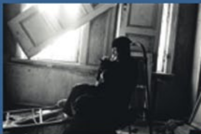
Andris Grīnbergs. „Vecā māja” / The Old House . 1977.