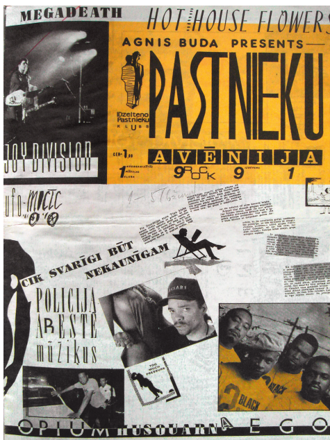
Izdevuma Pastnieku Avēnija titullapa Pastnieku Avēnija publication's front cover