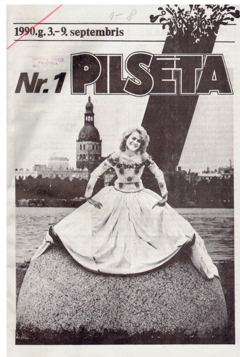
Žurnāla Pilsēta titullapa Pilsēta magazine front cover

Viens no spilgtākajiem 90. gadu sākuma gaisotnes atspulgiem bija Rīgas informācijas biroja un uzņēmuma "Forums" izdots, ar šķērēm un gumijas līmi maketētais melnbaltais žurnāls "Pilsēta" – Rīgā notiekošo pasākumu un sarīkojumu afiša, kādas mēdz iznākt ikvienā Eiropas pilsētā, Latvijā bija kaut kas jauns un nebijis. Tāpat kaut kas vēl nepieredzēts bija žurnālā publicētie Jāņa Borga jeb "Observatora" restorānu un kafejnicu apraksti, no