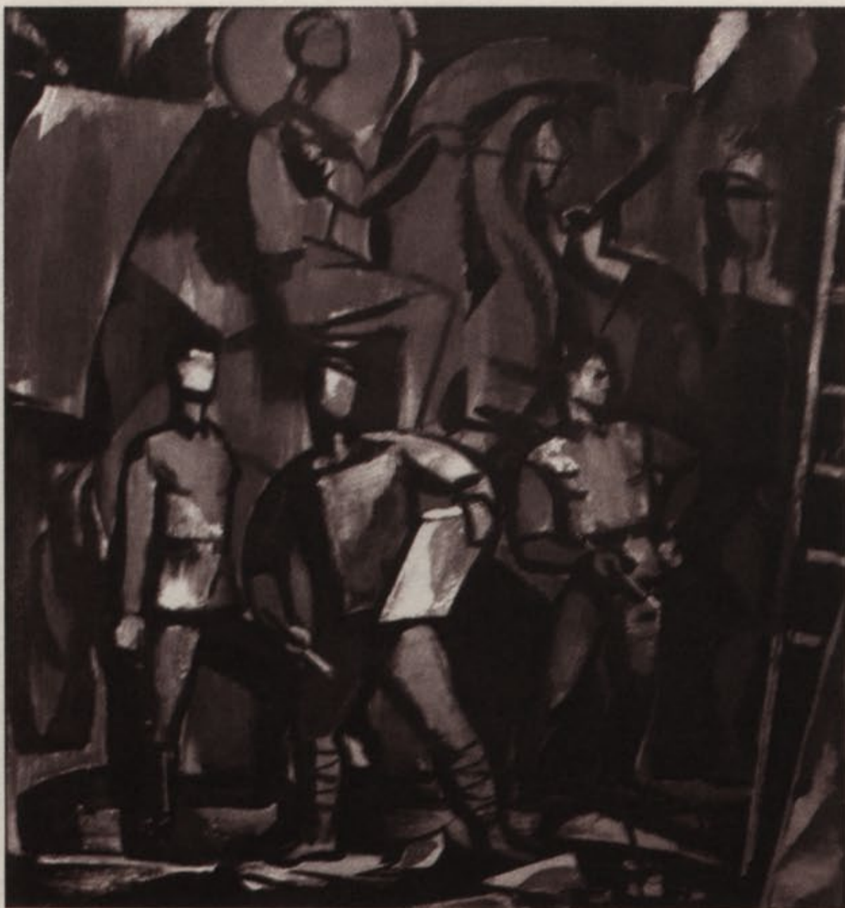
Ojārs Ābols. Prolets ved sauli [Latviešu mākslinieki 1919. gadā]. 1968. Gleznas mets. Audekls, eļļa / Proletus Leading the Sun [Latvian Artists in 1919]. Sketch. Oil on canvas 54 x 50 cm. 1968. Džemmas Skulmes īpašums / Džemma Skulme's property

And what's left when the surface layer is removed? In physical terms, a Virgin on a dashing horse, led by a Hero. In spiritual terms, it is the idea of Art. That possessed by the young artists of 1919 at a time when they possessed nothing. At an allegorical level, behind the references, it is important to perceive this vividly presented idea, the all-embracing spirit of liberation.