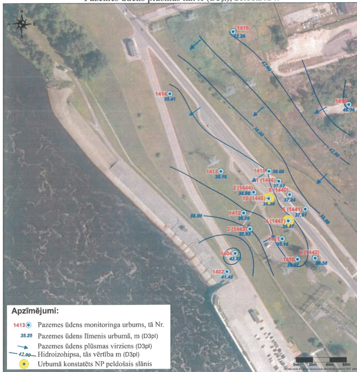
Pazemes ūdens plūsmas karte (D3 pl ), 21.11.2024.

Atbilstoši veiktajiem mērījumiem, sagatavotas pazemes ūdens plūsmu kartes, 4.attēls – Pļaviņu ūdens nesošais horizonts, 5. attēls – Daugavas ūdens nesošais horizonts.