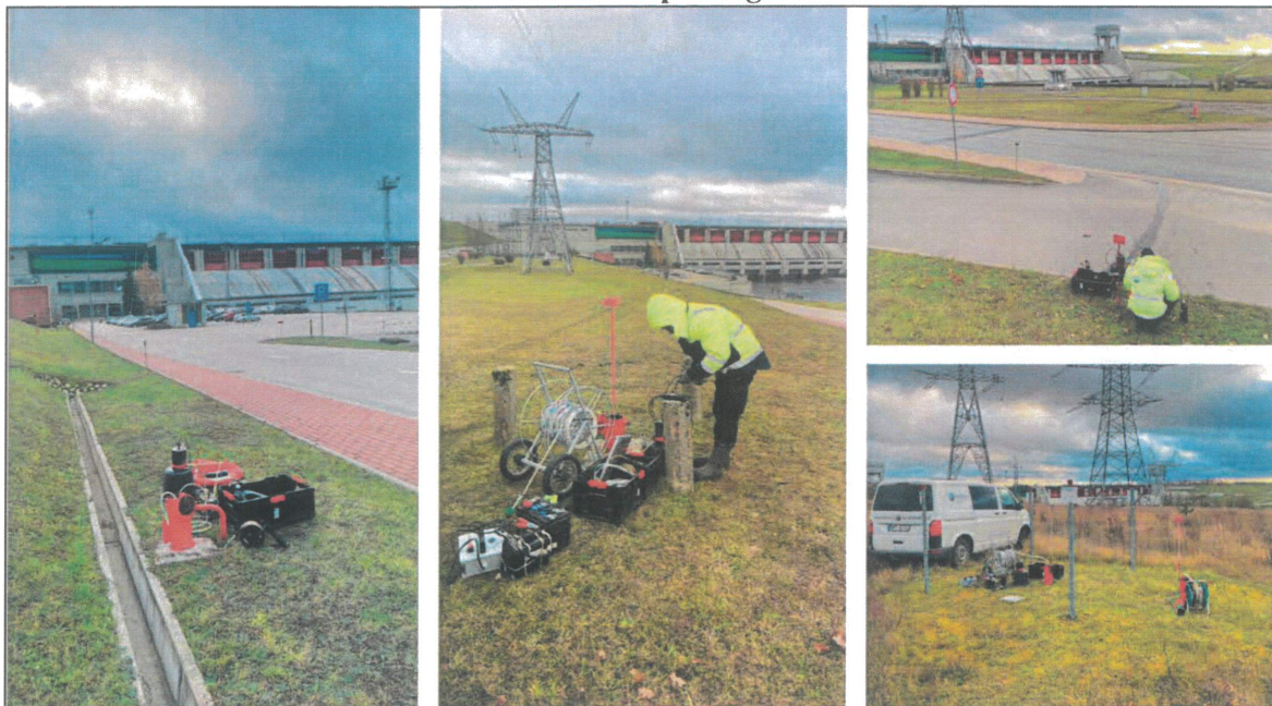
6.ATTĒLS