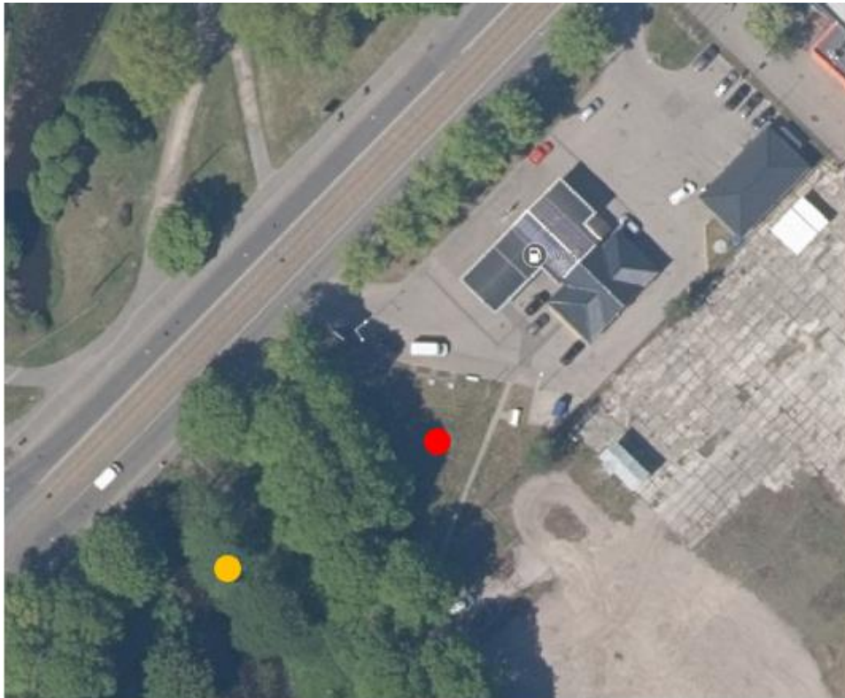
1. attēls. A/S „VIRŠI-A” DUS “Arkādijs” lietus notekūdeņu attīrīšanas iekārtu atrašanās vieta ● un attīrīto notekūdeņu izplūdes vieta ●

Attīrītie lietus notekūdeņi tiek novadīti uz Mārupīti (NAI izvietojumu un notekūdeņu izplūdi skatīt 1. attēlā).