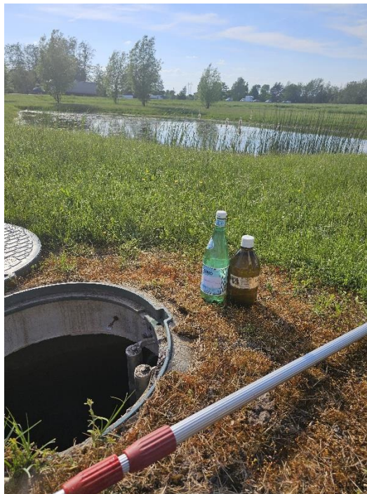
2. attēls. Skats uz pēdējo aku pirms izplūdes dīķi, kurā tika noņemts lietus notekūdeņu paraugs (27.05.2024.)

Parauga ņemšanas laikā tika piefiksēti laikapstākļi – 27.05.2024. laiks bija dūmakains, gaisa temperatūra sasniedza + 26,2 °C.