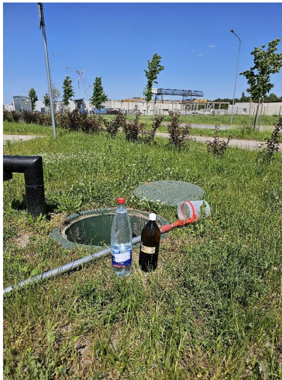
2.attēls. Paraugu noņemšanas aka un lietus notekūdens paraugi (27.05.2024.)

Parauga ņemšanas laikā tika piefiksēti laikapstākļi – 27.05.2024. laiks bija saulains, gaisa temperatūra sasniedza + 28,3 °C.