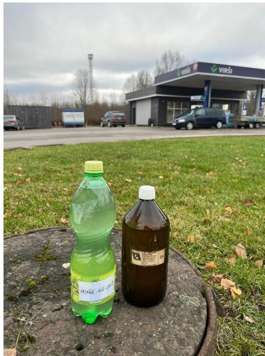
2.attēls. Skats uz kanalizācijas aku notekūdeņu attīrīšanas iekārtu izplūdē, kurā tika noņemts lietus notekūdeņu paraugs (06.11.2024.)

Parauga ņemšanas laikā tika piefiksēti laikapstākļi – 06.11.2024. laiks bija apmācies, bez nokrišņiem, gaisa temperatūra sasniedza +9,4 °C.