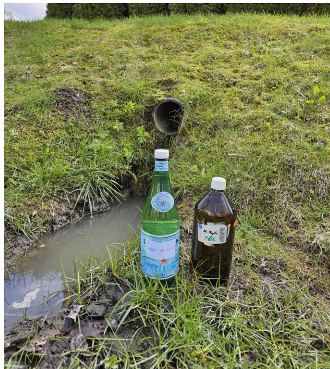
2.attēls. Skats uz parauga ņemšanu attīrīto lietus notekūdeņu izplūdē (24.04.2024.)

Parauga ņemšanas laikā tika piefiksēti laika apstākļi – 24.04.2024. laiks bija mākoņains, gaisa temperatūra sasniedza +8,7 °C.