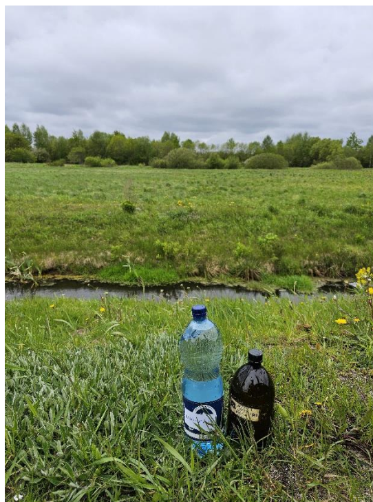
6. attēls. Skats uz aku, kurā izplūst NAI attīrītie ražošanas notekūdeņi, un izplūstošo notekūdeņu paraugu ņemšanas vietu (10.05.2024.)