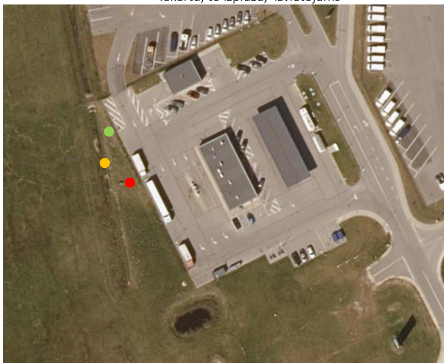
2. attēls. A/S „VIRŠI-A” DUS “Mārupe”