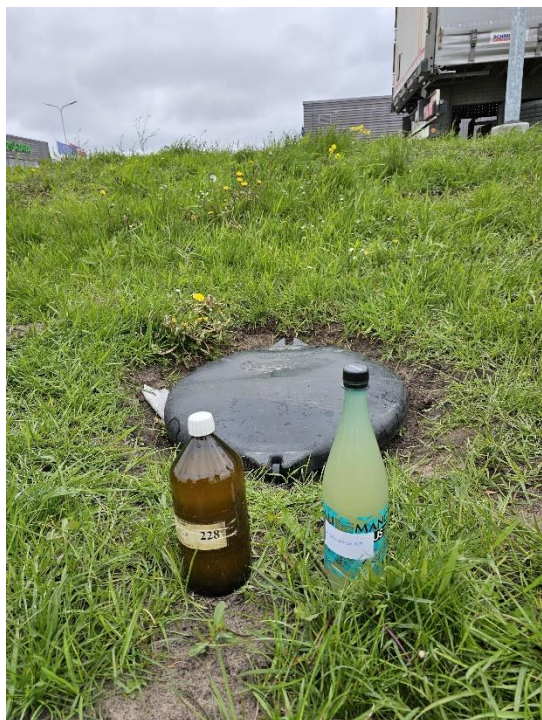
3.attēls. Skats uz sadzīves notekūdeņu attīrīšanas iekārtas ieplūdes aku un ieplūstošā sadzīves notekūdeņu paraugu ņemšanas vietu (10.05.2024.)