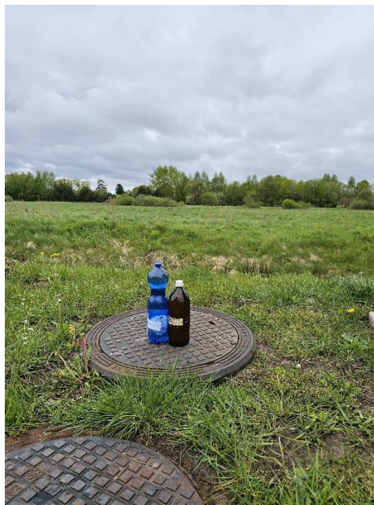
4. attēls. Skats uz aku, kurā izplūst NAI attīrītie sadzīves, un izplūstošo notekūdeņu paraugu ņemšanas vietu (10.05.2024.)