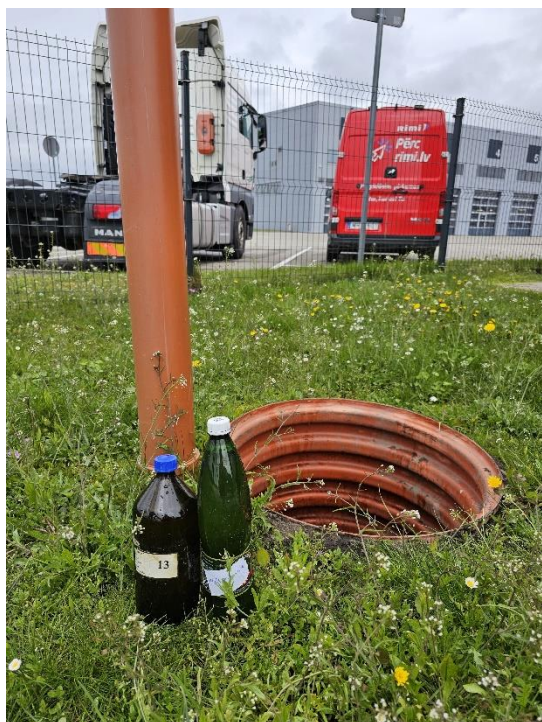
5.attēls. Skats uz ražošanas notekūdeņu attīrīšanas iekārtas ieplūdes aku un ieplūstošā ražošanas notekūdeņu paraugu ņemšanas vietu (10.05.2024.)